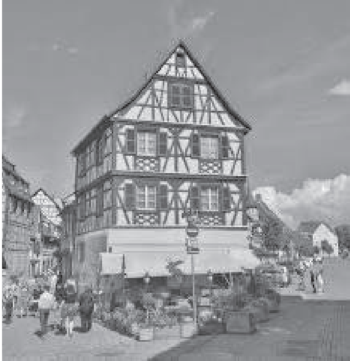
काठको फ्रेममा बनाइएका कलापूर्ण घर