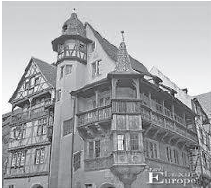
सहरको केन्द्रमा रहेको माइसन फिस्टर भनिने कलात्मक घर