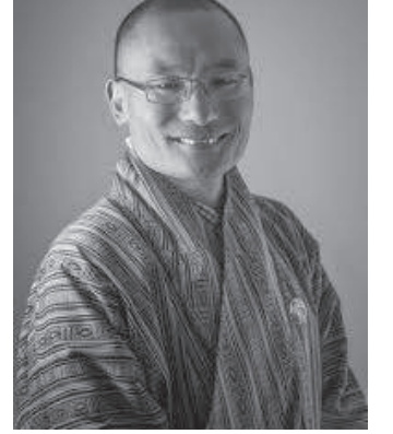
भारतका कठपुतली वर्तमान प्रधानमन्त्री छिदिङ तोग्वे

जब जिग्मे थिन्ले भुटानका प्रथम निर्वाचित प्रधानमन्त्री बने उनी अन्तराष्ट्रिय कूटनीतिमा ज्ञाता पनि थिए । तब उनले चीनसँगको भुटानको सीमा जाकारलुङ, पासमलुङ र दोक्लाम भएको कारण चीनसँगको सम्बन्धलाई नकार्न नसकिने र क्रमशः चीनसँग द्विपक्षीय सम्बन्धको विकास गर्नेपनि जिक्किर गर्न थाले । सन् २०१२ मा थिन्लेले रिओ दे जेनारियोमा चीनका प्रधानमन्त्री वेन चि वाओ भेट गरी चीनसँग २० वटा वस किन्ने प्रतिवद्धता जाहेर गरे