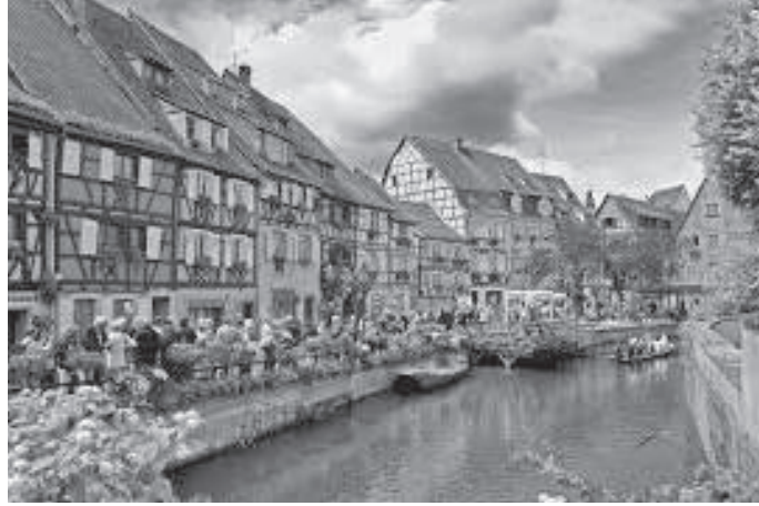
सानो भेनिसको रूपमा कोलमार यस्तो देखिन्छ