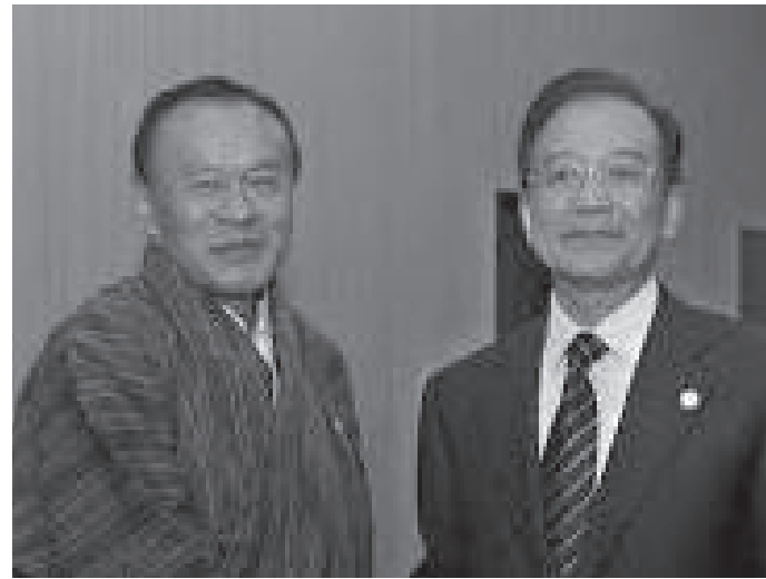
थिन्ले चिनियाँ प्रधानमन्त्री वेनसँग

निर्यात गर्ने वस्तुको ९८ प्रतिशत भारत जान्छ भने ९० प्रतिशत आयात भारतबाट हुन्छ । भुटानमा शाही सेनालाई तालिम दिने नाममा १००० भारतीय सैनिक बल स्थायी रूपबाट पश्चिम भुटानमै रहने गरेको छ । भुटान र भारतबीच कुनै वैधानिक सीमा रेखा छैन र जब जब भुटान सीमा वैज्ञानिक बनाउ भन्छ भारत सुनेको नसुन्छ गछ । वेलाका बुद्धि नपुन्याएपछि लाचार भुटानले भारतविरुद्ध गर्ने के सक्छ र ? यद्यपि संयुक्त राष्ट्रसंघको सदस्यता लिने कुरामा भारतले छेका नहालेको कारण परराष्ट्र, रक्षा, अन्तराष्ट्रिय व्यापार, ऊर्जा सबै भारतको अधिनमा हुँदाहुँदै