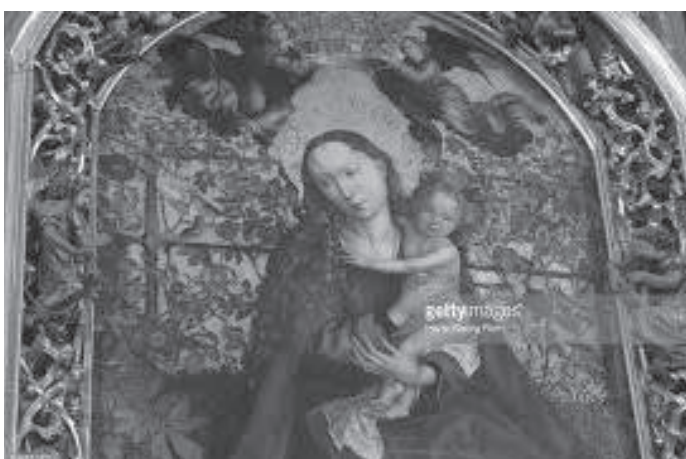
मार्टिन चर्चभित्रको सोनगावर रोज गार्डेन पेन्टिङ