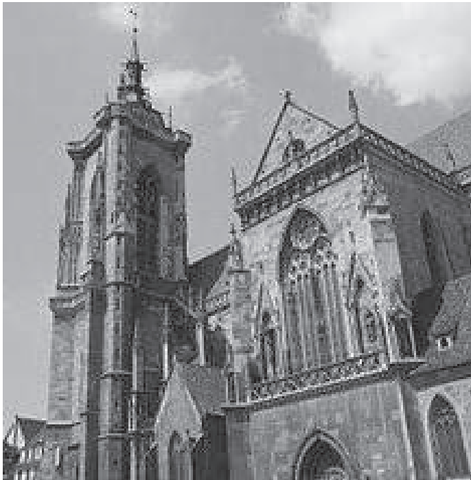
कोलमार सहरभित्रको सेन्ट मार्टिन चर्च