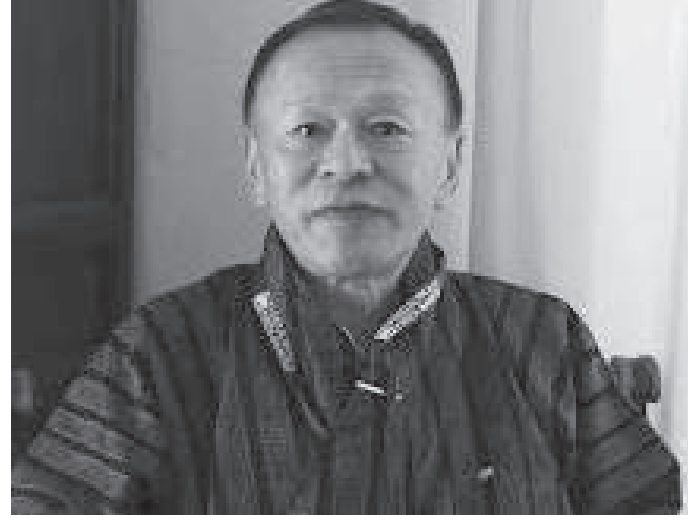
राष्ट्रवादी प्रधानमन्त्री जिग्मे थिन्ले

भन्दै त्यही बेला चिनियाँ लालसेनाले नेपाल, सिक्किम भुटान र बर्मालाई आफूमा गाभ्यो होला । नेपालले जस्तै चीनसँगको सम्बन्धलाई भुटानले १९४७ पछि महत्व दिनुको भने भुटान भारतको दास हुनुपर्ने थिएन । हाल भुटानको ६०५ किलोमिटर सीमा भारतसँग जोडिएको छ । भुटानले