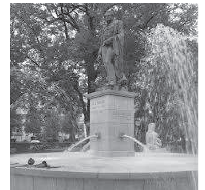
सहरभित्रका मूर्तिसहितका फोहरा