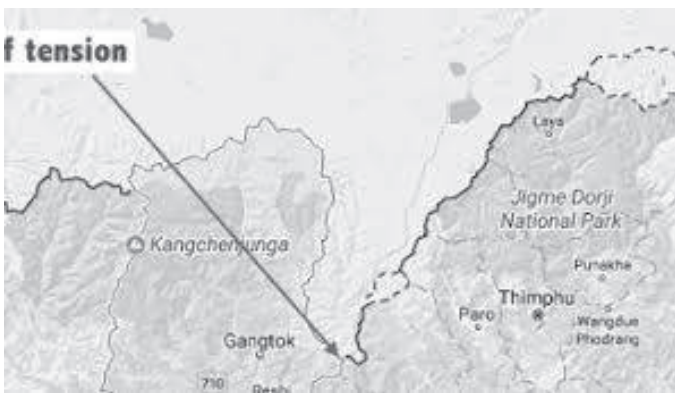
सिक्किम र तिब्बत नजिकै रहेको दोक्लाम

पोल्टामा आफूलाई हाल्यो । जबकी चीनको भुटान खाने कुनै रहन थिएन । माओ जे दुइको परराष्ट्र नीतिमा तिब्बत भनेको हत्केला र यसका पाँच औंला भनेको लदाख, नेपाल सिक्किम, भुटान र बर्मा हुन् तसर्थ यी देशहरूमा चीनले राम्रो सम्बन्धको विकास गर्नुपर्छ भन्ने थियो । अन्यथा तिब्बतको सुरक्षा