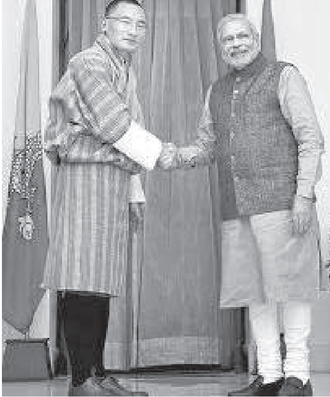
प्रधानमन्त्री तोग्वेलाई दिल्लीमा स्वागत गर्दै मोदी

भारतमा अंग्रेज होउन्जेल अंग्रेजको संरक्षित क्षेत्र बनेर बस्ने बानी परेको भुटानले चीनको त्रासले गर्दा आफूलाई भारतको दास बनाउँदै भारतको