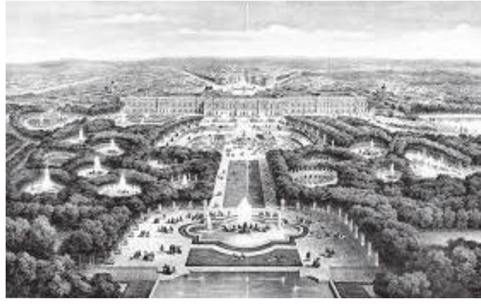
सिंगो भर्साइ दरबार र बगैँचा