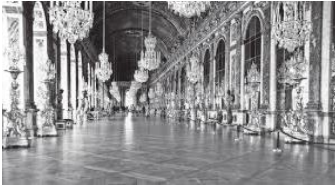
दरबारभित्र विशाल ऐना भएको हल