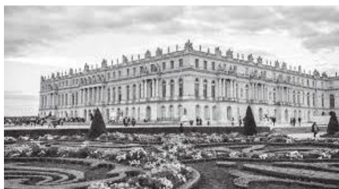
भर्साइ दरबारको अग्र भाग

फ्रान्सेन ब्लाको दरबार र बगैँचा हेर्दाहेर्दै अपराह्नको ४ बजिसकेको थियो । अब हाम्रो ध्यान भनेको क्याम्पिड साइट पत्ता लगाई त्यहाँ पुगी बेलुकीको खानाको जोह गर्ने र मोटरमा नै रात बिताउने कुरामा केन्द्रित थियो । फ्रान्सेन ब्ला हेरिसकेर हामी त्यस क्रममा राजमार्ग पहिल्याई उत्तरतिर हानियौं । करिब दुई घन्टाको हकाइपछि क्याम्पिड साइट पुगी हामीले आफूलाई व्यवस्थित गर्नु भयो । भोलिपल्ट विहान हल्का खाना खाई हामी आफ्नो गन्तव्यतिर हानियौं । त्यस दिनको हाम्रो लक्ष्य भनेको विश्वविख्यात भर्साइको दरबार र त्यहाँको बगैँचा हेर्नु थियो । करिब ११ बजेतिर हामी भर्साइको दरबार आइपुग्यौं अनि त्यहाँको दरबार बगैँचा अवलोकन गर्नतर्फ लाग्यौं ।