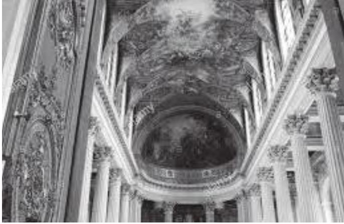
दरबारभित्रको गजुरमा गरिएको कलाकृति