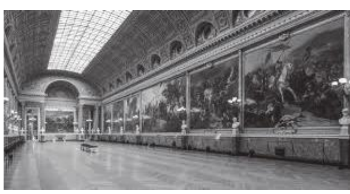
दरबारभित्रको युद्धस्मारक ग्यालेरी