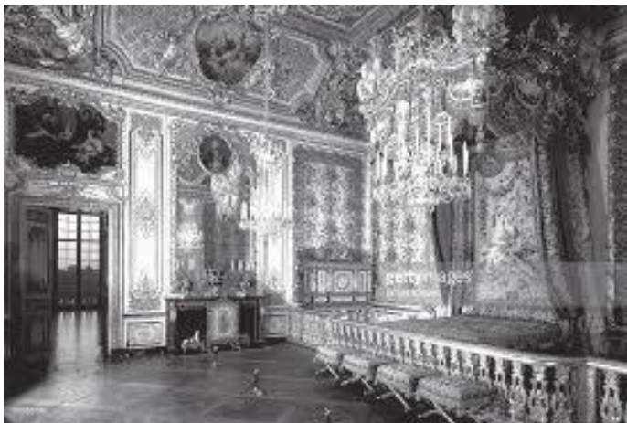
दरबारभित्रको सम्राज्ञी मेरीको सयनकक्ष