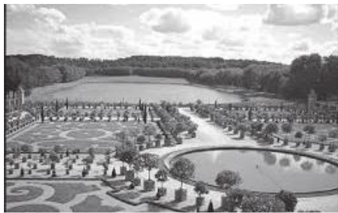
भर्साइ दरबारभित्रको बगैँचा