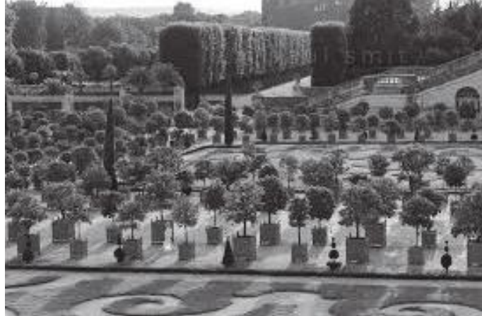
दरबारभित्रको सुन्तला बगैँचा