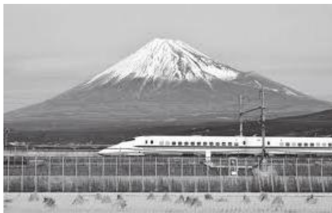
अनि कहीं हिमचुलीको फेदीबाट