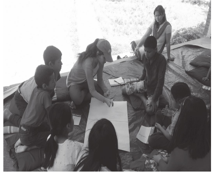
समूहमा छलफल गर्दै बालबालिकाहरू