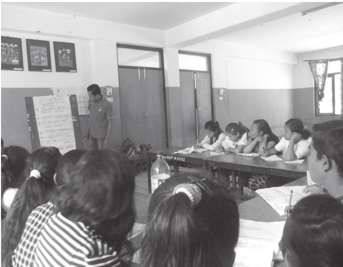
तालिममा प्रस्तुतिकरण गर्दै सहभागी