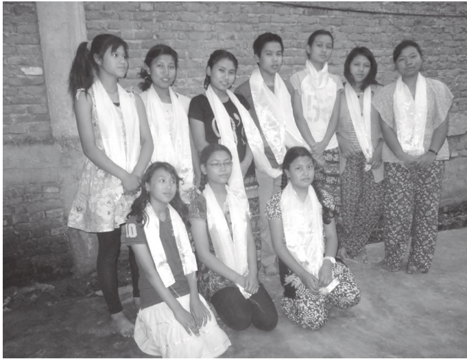
पुनर्गठित बालक्लवका पदाधिकारीहरू