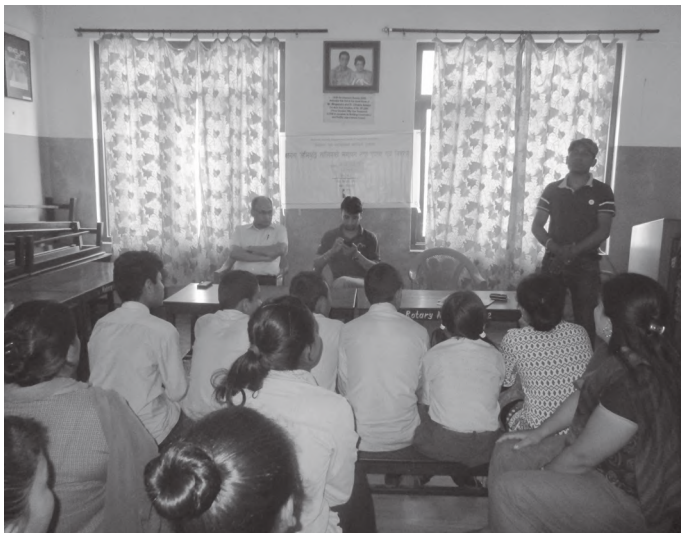
तालिम समापनका सहभागीहरू