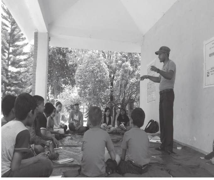
अभिमुखीकरणको सहजिकरण गर्दै संस्थाका कर्मचारी