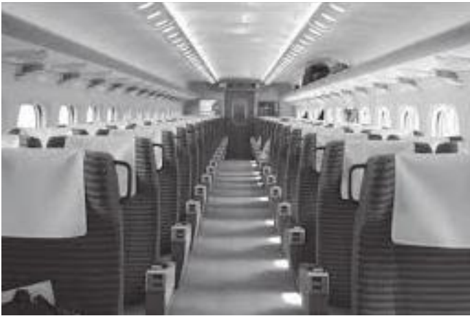
बुलेट ट्रेनको भित्री भाग