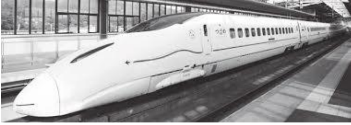
बुलेट ट्रेन यस्तो देखिन्छ