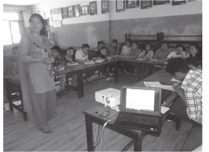
तालिमको सहजिकरण गर्दै संस्थाका कर्मचारी