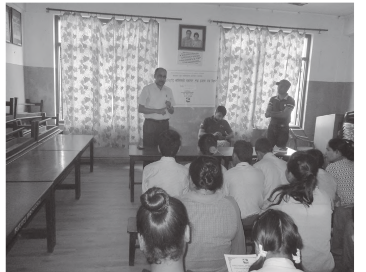
कार्यक्रममा मन्तव्य राख्दै संस्थाका उपमहासचिव पौड्याल