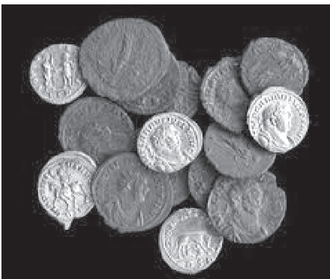
म्युजियमभित्र रहेको प्राचीन सिक्काहरू

प्राप्त पुरातात्विक वस्तुहरू रहेछन्। पछि सन् १७७२ मा म्युजियम आफैले ८४१० पाउण्डमा सर विलियम हामिल्टनले गरेका माटाले बनेका कलापूर्ण ग्रीक सभ्यताकालिन घैंटा र गमलाहरूको संग्रहहरू पनि खरिद गरेको रहेछ। पछि १९औं शताब्दीको शुरुमा नै ग्रीस, रोमन इजिप्टियन सभ्यता कालिन पुरातात्विक मूर्तिहरू यस म्युजियममा थपिन आएका रहेछन्। नाइल नदीको युद्धमा फ्रान्सको हार बेलायतको जितको