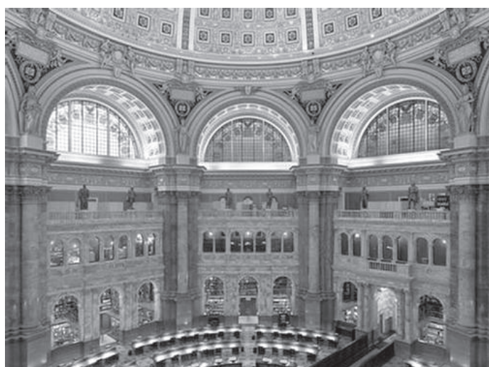
म्युजियमभित्र रहेको केन्द्रीय पुस्तकालय

इम्पेरियल वार म्युजियम हेरिसक्दा दिनको एक मात्र बजेको थियो। त्यसपछि हामी लण्डनको ब्लुम्सवेरी इलाकामा रहेको ब्रिटिस म्युजियम हेर्नतर्फ लाग्यौं।