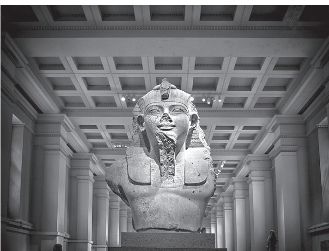
म्युजियमभित्र रहेको प्राचीन सभ्यताकालीन मूर्ति