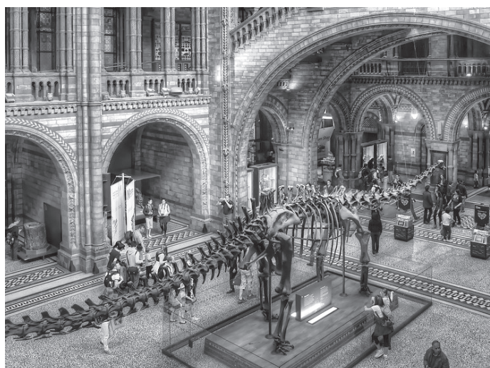
म्युजियमभित्र रहेको दिनासुरको अस्थिपञ्जर