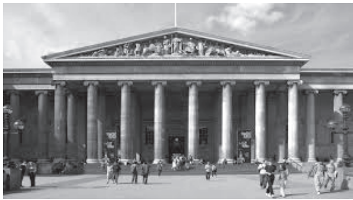
ब्रिटिस म्युजियमको अग्र भाग