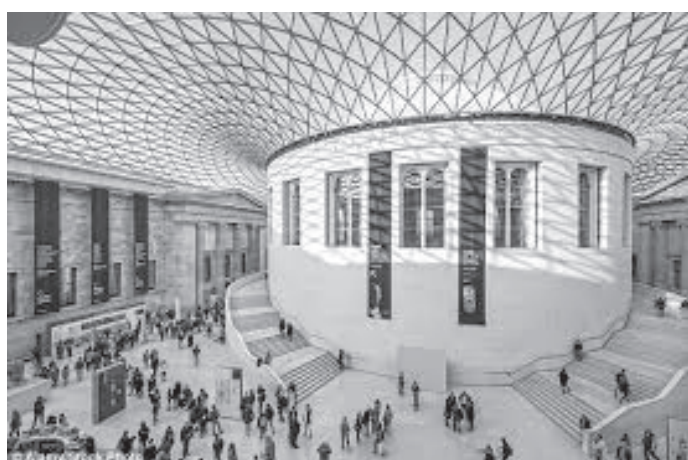
म्युजियमभित्र पर्यटकको घुइँचो