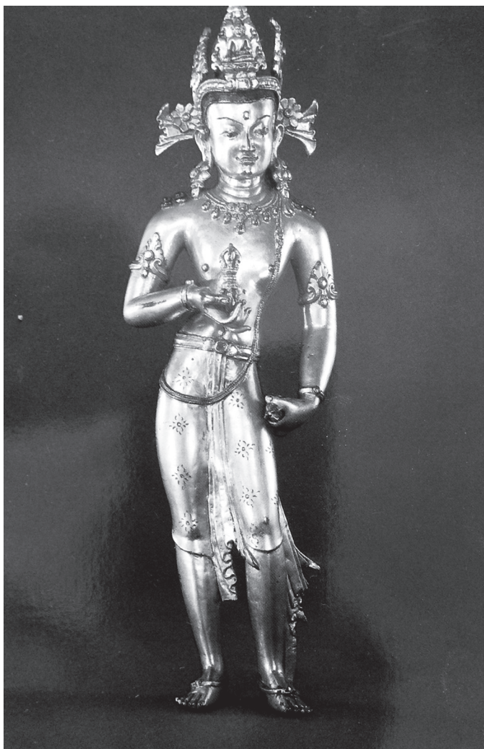
म्युजियमभित्र रहेको नेपालबाट लिएको बुद्धको मूर्ति