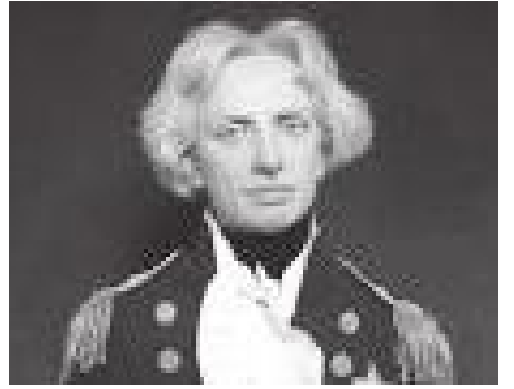
म्युजियममा रहेको लर्ड नेल्सनको मूर्ति