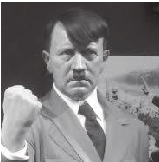
म्युजियममा रहेको हिटलरको मूर्ति

ब्रिटिस म्युजियम हेर्दा हेर्दै दिन ढल्की हाल्यो । हामी आफ्नो कार लिएर क्याम्पिंग साइट तर्फ लाग्यौं । बेलुकाको खाना खाई सुत्थौं र भोलीपल्ट विहान हल्का नास्ता गरी लाग्यौं हामी लण्डन स्थित म्याडम टुसा म्युजियम हेर्न ।