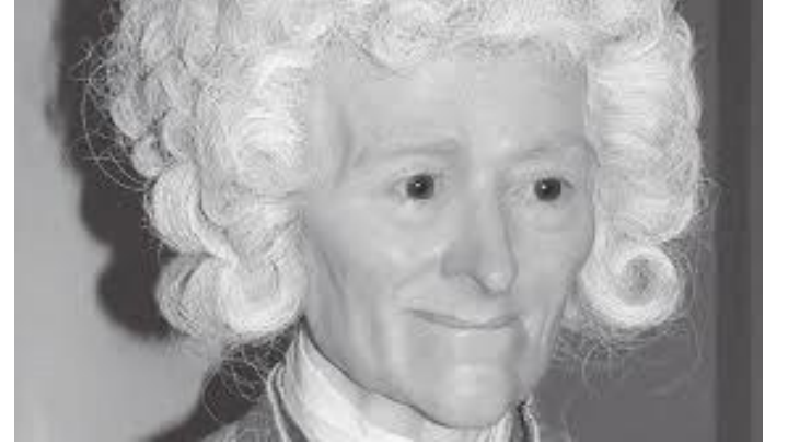
म्युजियममा रहेको भोल्तेयरको मूर्ति