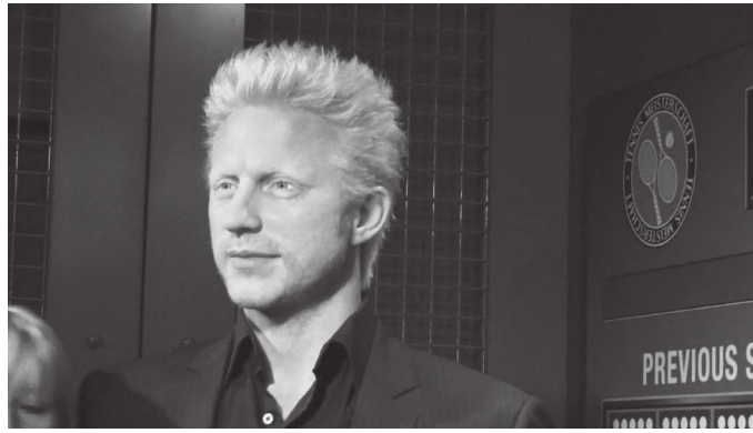
म्युजियममा रहेको बोरिस बेकरको मूर्ति