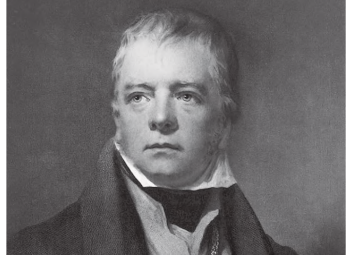
म्युजियममा रहेको सर वाल्टर स्कटको मूर्ति