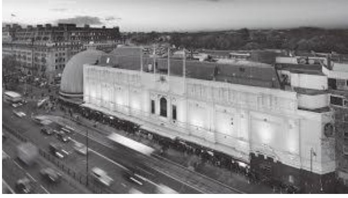
लण्डनमा रहेको म्याडम टुसा म्युजियम