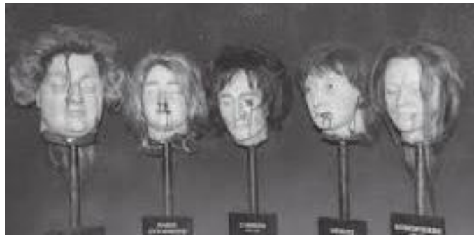
म्युजियममा रहेको च्याम्बर अफ होरर