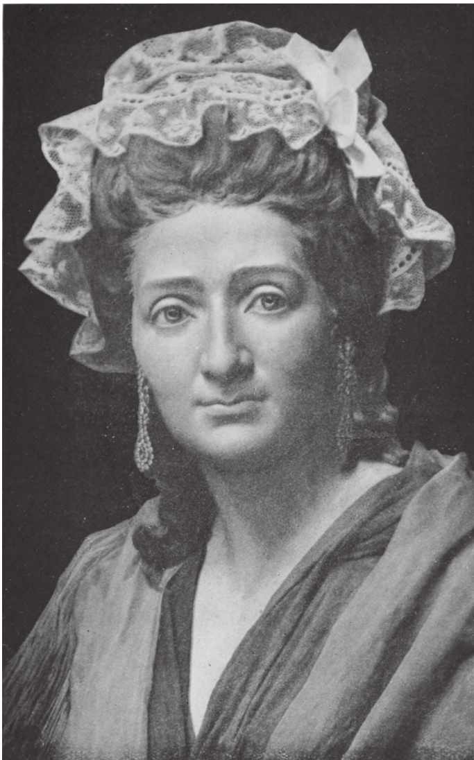
म्याडम टुसाको आफ्नै मूर्ति