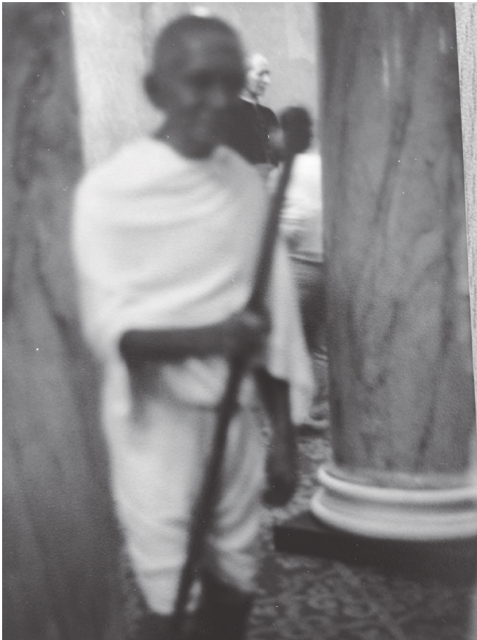
म्युजियममा रहेको महात्मा गान्धीको मूर्ति