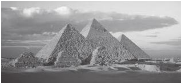
भग्नावशेषसहित ९ वटा पिरामिड