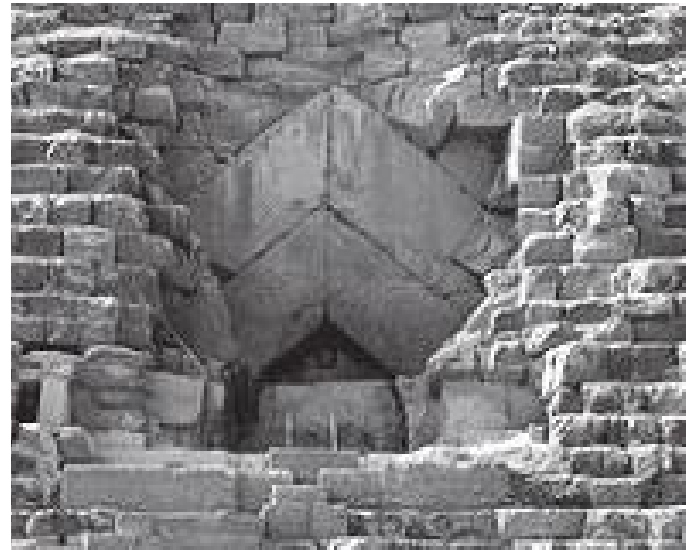
सबैभन्दा ठूलो पिरामिडको मुख्य द्वार

प्राचीनकालमा पनि मानव ती आश्चर्यसँगको मेरो साक्षात्कार निर्मित विश्वका आठ आश्चर्यहरू हुने क्रम पनि क्रमशः बढ्दै गइरहेको थिए। त्यसैगरी मध्यकालमा पनि मानव निर्मित विश्वका आठ आश्चर्यहरू बने अनि त्यसैगरी आधुनिक कालमा पनि त्यस्तै आश्चर्यहरू सिर्जना हुँदै गए।