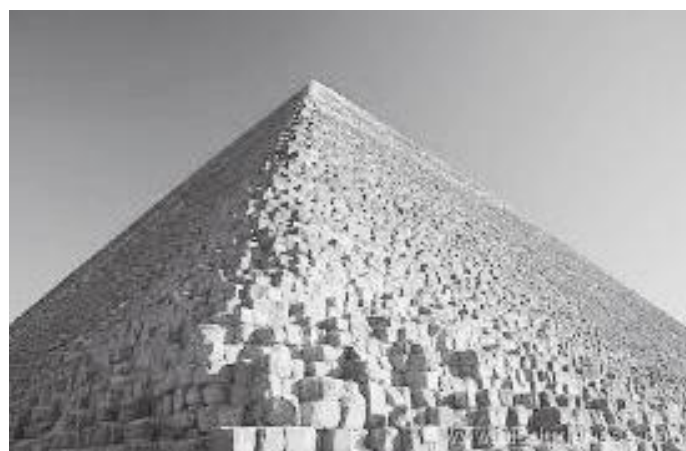
सबैभन्दा ठूलो पिरामिड केओप्स