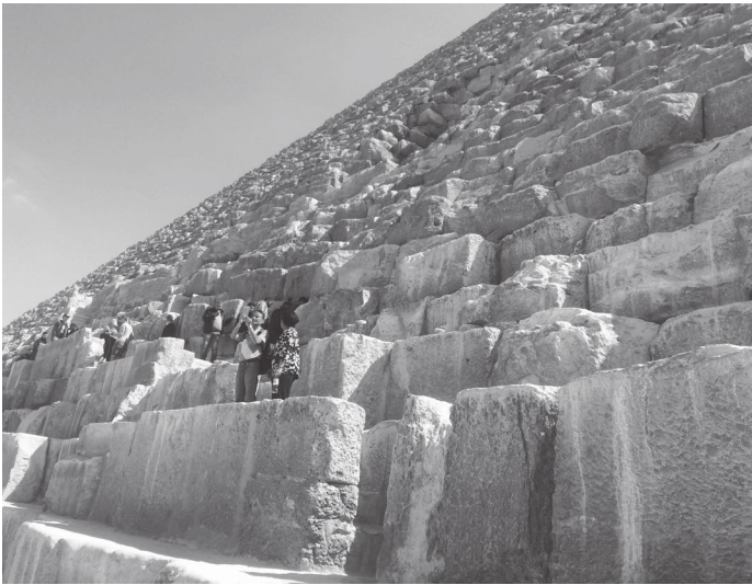
मुख्य द्वारसम्म जाने बाटो