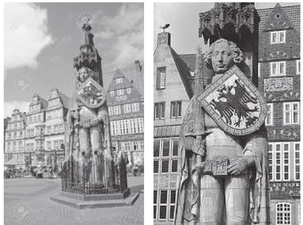
स्ववायरको बीचमा रहेको रोलाण्डको मूर्ति र यसले बोकेको नांगो तरवार र दुई टाउके चील भएको ढाल

ब्रेमेनको टाउनहल हेरिसकेपछि म डेरा फर्किएँ। फेरि अर्को दिन सिनेटको काम सकी तीन बजे म सोही ब्रेमेनको भित्री बजार क्षेत्र (मार्केट स्ववायर) रोलाण्डको मूर्ति र भित्री बजार क्षेत्रमा रहेका पुराना घरहरू हेरेर दुई घण्टा बिताएँ।