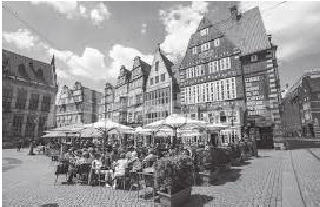
बजार स्ववायरमा पर्यटकहरू