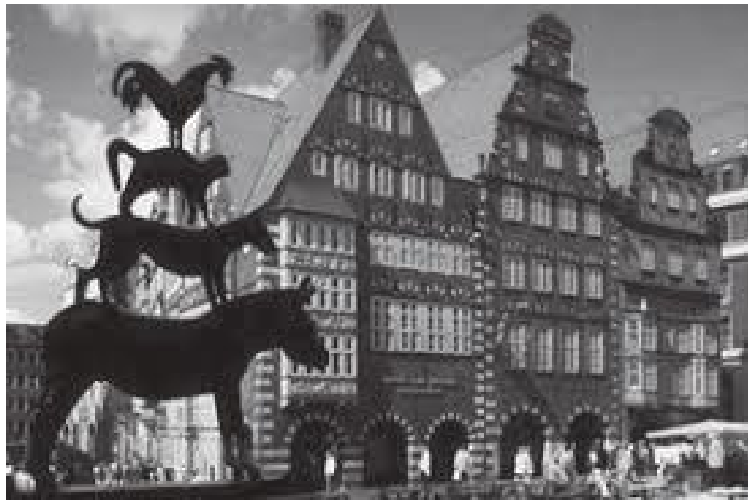
भित्री बजारको सबैभन्दा प्राचीन खण्ड यस्तो रहेछ