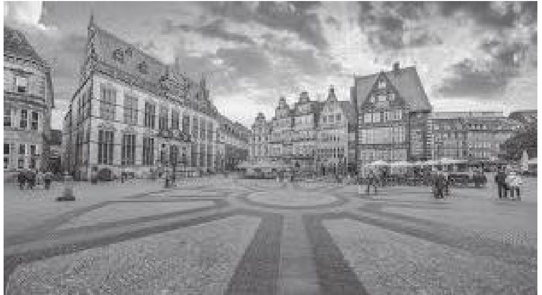
बजार स्ववायरको बीचमा रहेको मण्डला जस्तो देखिने रंगीन क्रस