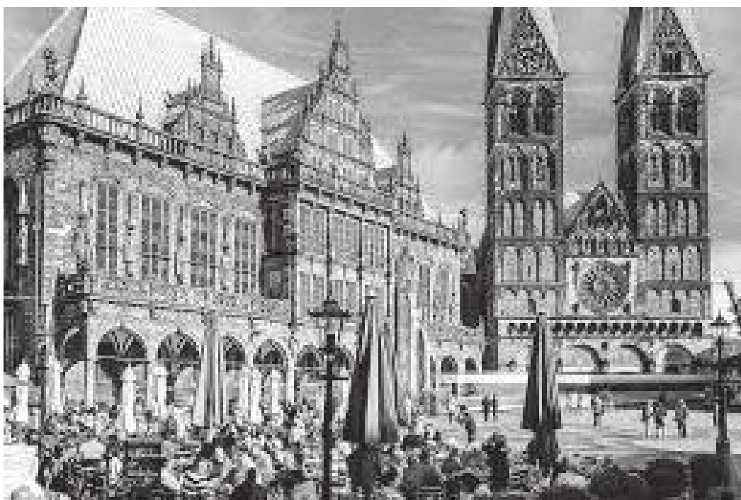
ब्रेमेन बजार स्ववायर अगाडिबाट हेर्दा