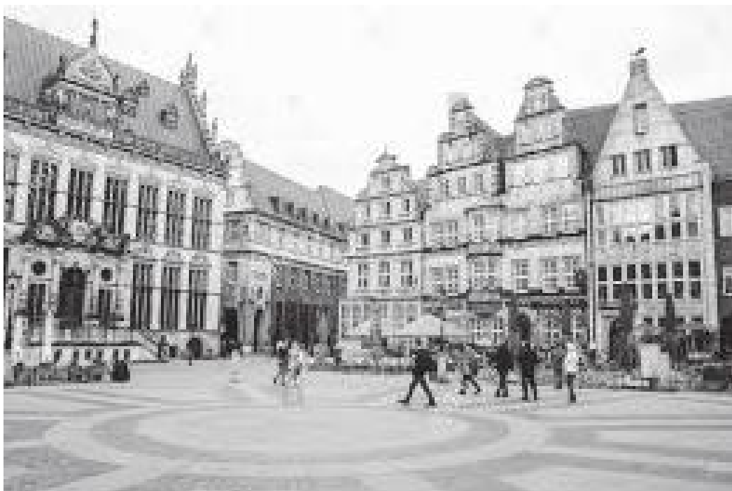
स्ववायरमा ठडिएका सुन्दर तथा प्राचीन आकर्षक भवनहरू