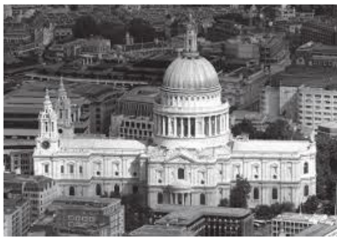
भन्डै भेटिकनको सेन्टपिटर चर्च जस्तै देखिने लण्डनको सेन्ट पाउल चर्च