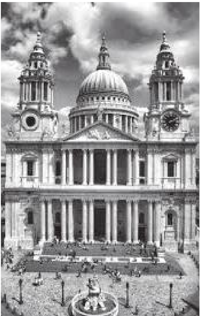
काथेड्रलको अग्र भाग