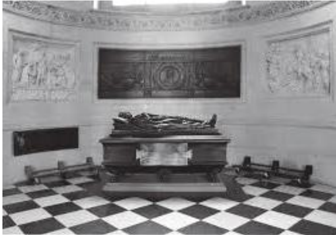
काथेड्रलभित्र रहेको चिहान