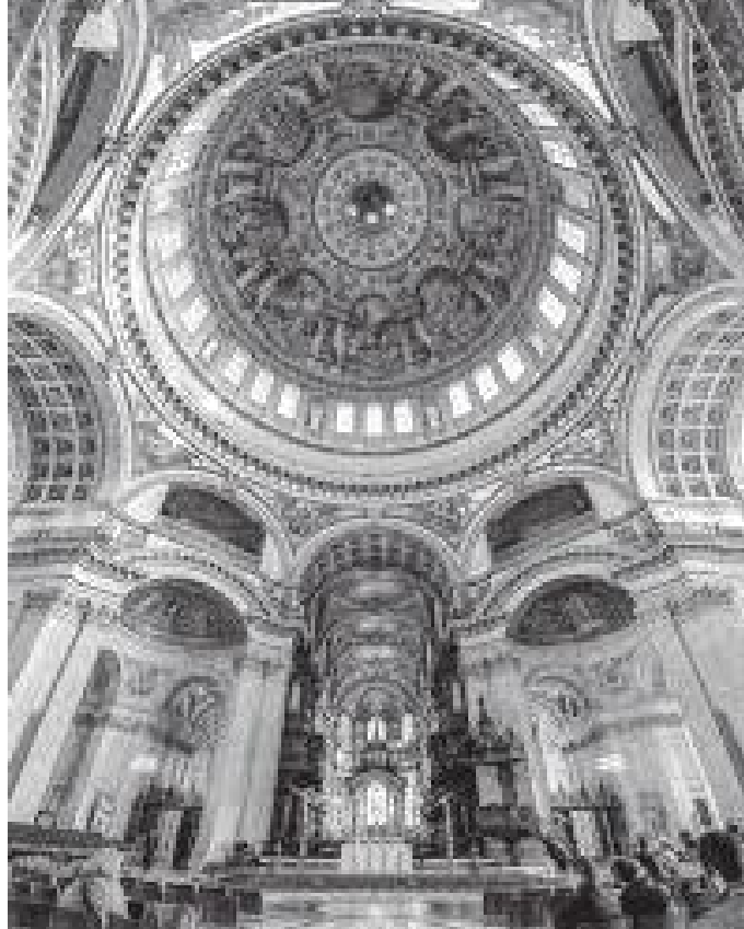
केथेड्रलको गजुरको भित्री भागमा गरिएको पेन्टिङ