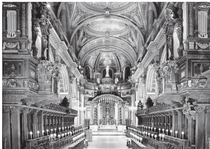
केथेड्रलको कलात्मक भित्री भाग