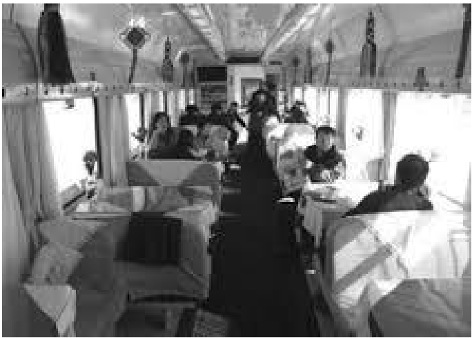
रेलको भित्री भाग