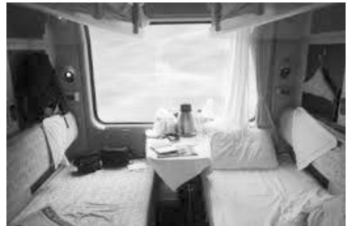
सुल मिल्ने रेलको डिब्बा