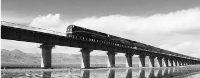
कहीं कहीं पुलमाथिबाट यस्तो रेल दौडन्छ