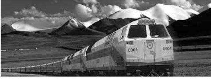
रेलले छिचोले मनमोहक हिमाली श्रृंखला