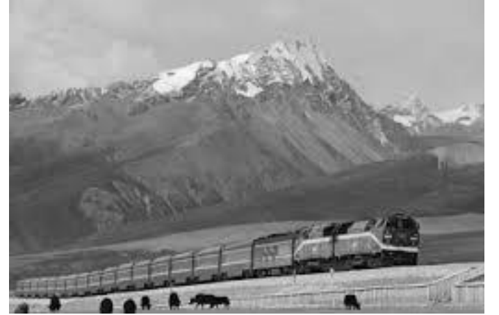
संसारकै उच्च स्थलबाट रेल कुद्दै