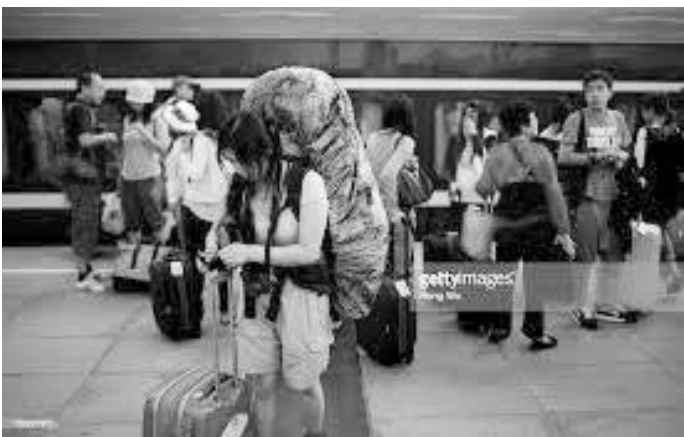
रेल्वे स्टेसनमा पर्यटकको भीड