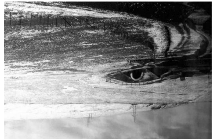
कहीं कहीं यस्तो सुरुङबाट रेल छिई