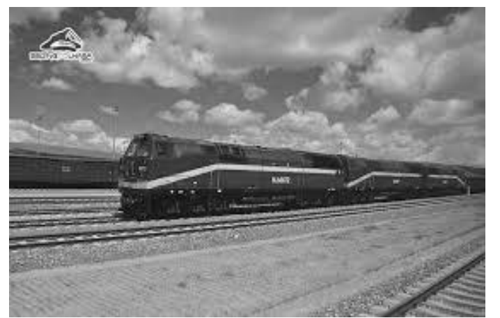
भविष्यमा काठमाडौँ आउने चिनिया रेल यस्तै होला