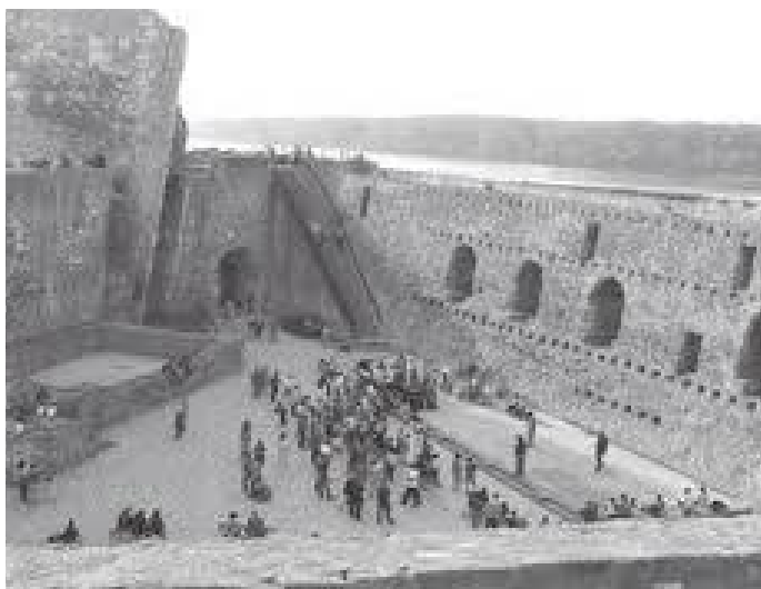
किल्लाभित्र पर्यटकको घुइँचो