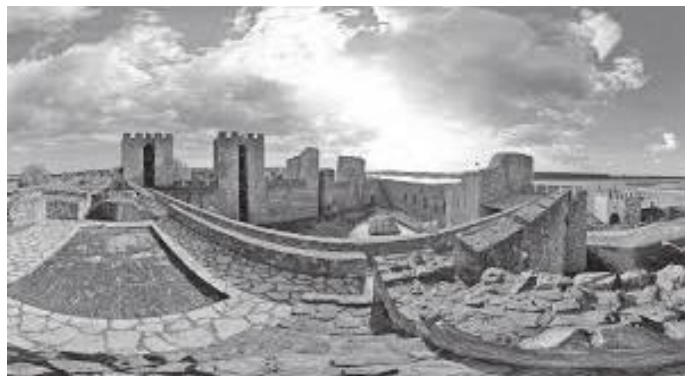
जिर्णोद्वारपछि किल्लाको वर्तमान रूप