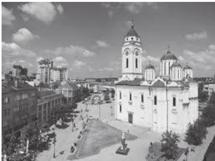
किल्लासँगै रहेको स्मेडेरेभो सहर