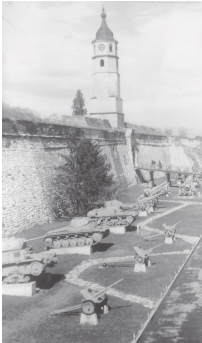
किल्लाभित्र संरक्षण गरिएको तोप गोलाबारूद