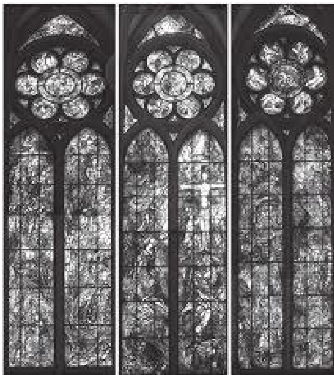
क्याथेड्रलभित्रको गोथिक शैलीको कलात्मक सिसाको भ्याल