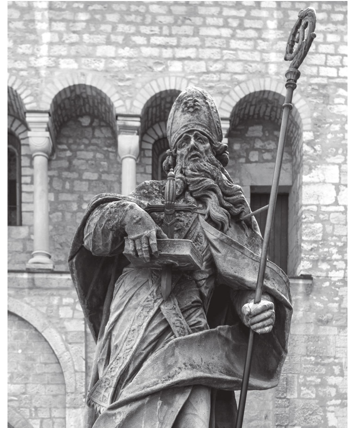
क्याथेड्रलको चोकमा रहेको सेन्ट बोनिफेसको मूर्ति