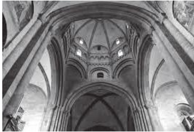
क्याथेड्रलभित्रको धनुषकार कलात्मक दलिन