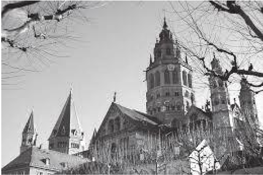
बाहिरबाट हेर्दा माइन्जको क्याथेड्रल यस्तो देखिन्छ