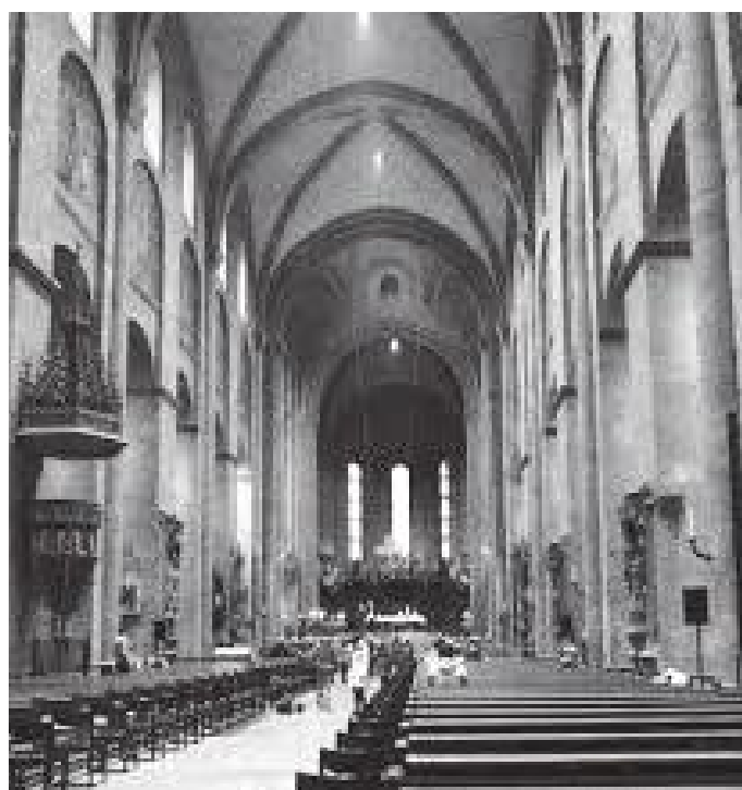
क्याथेड्रलको मुख्य प्रार्थना कक्ष (नेभ)

पनि रहेछ । चर्चको विशाल चोकमा सेन्ट बोनिफाचे र मादोन्नाका मूर्तिहरू रहेछन् । चर्चको अर्को आकर्षण भनेको एक हजार वर्षमा सिर्जना गरिएका धार्मिक कलाकारिताको प्रस्तुति पनि रहेछ । सन् ९७५ देखि १०११ सम्ममा नै माइन्ज शहर आर्थिक समृद्धिको पराकाष्ठमा पुगेको रहेछ । त्यही बेला भिलिगिस सम्राट बनेका रहेछन् र उनैले प्रागोमानी अतोनिनियन शैलीमा यो क्याथेड्रल निर्माण गर्न लगाएका रहेछन् । यसै कारण माइन्जलाई दोस्रो रोम पनि भनिंदो रहेछ । प्रार्थना कक्ष माथिको दलिन (भल्ट) हरू इन्द्रधनुषाकारमा कलात्मक पाराले बनाइएका रहेछन् । यी भल्टहरूलाई ६ वटा टावर जस्ता देखिने स्तम्भहरूले थगेका रहेछन् । हेनरी चौथो राजा हुँदा एघारौँ शताब्दिमा यसलाई पुनः सिंगारिएको रहेछ । अचम्मको कुरा के रहेछ भने सन् १००९ मा यो क्याथेड्रलको निर्माण सकी उद्घाटन गर्ने दिनमा नै आगालागि हुन गई राम्रै क्षति पुगेको रहेछ । क्याथेड्रलको सेन्ट स्टेफान कक्षमा सन् १०११ सम्राट भिलिगिसको चिहान राखिएको रहेछ । प्रार्थना कक्ष एक छेव (चान्सेल) को पूर्वी भाग सर्वसाधारण जनता बस्नको लागि र पश्चिमी भाग विशप र अन्य पादरीहरूको लागि तोकिएको रहेछ । यही पश्चिमी चान्सेल भने पुरै रोमको भेटिकन चर्चको जस्तै बनाइएको रहेछ । त्यतिखेर जर्मनीमा भएको तीन विशाल सम्राट क्याथेड्रलमध्येको पहिलो यो क्याथेड्रल दोस्रो भोम्सको र तेस्रो स्पायरको क्याथेड्रल पर्दा रहेछन् । सन् १११० र ११३७ विचको वर्षहरूमा जारबुकनका आर्कबिशप आडाल्ब्रेटले यहाँ दुई तले गजुर बनाउन लगाएका रहेछन् । पछि १२औँ शताब्दिमा गएर मुख्य प्रार्थनाकक्षलाई सिंगाने काम भएको रहेछ । पछि रोमन सभ्यताको