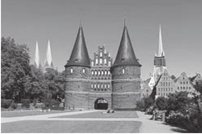
लुबेकको होल्स्टाइन गेट