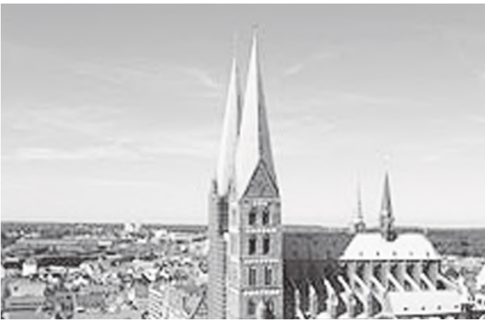
लुबेकको सेन्टमेरी चर्च