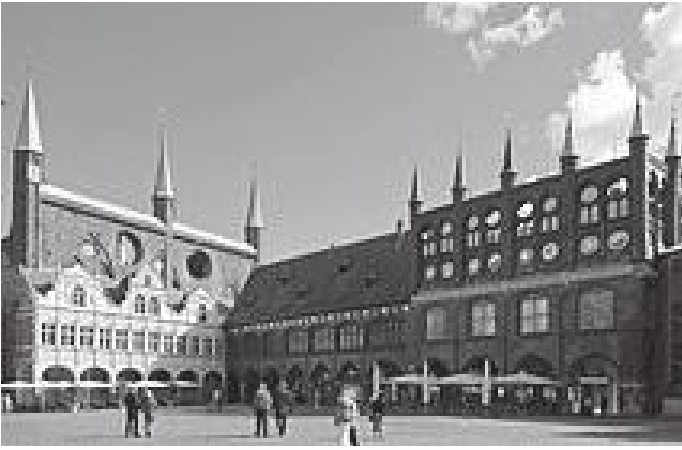
लुबेकको टाउन हल