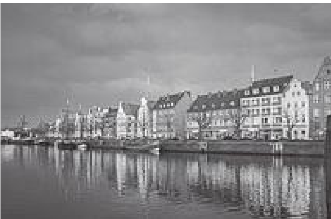
लुबेकको ट्रामे नदी