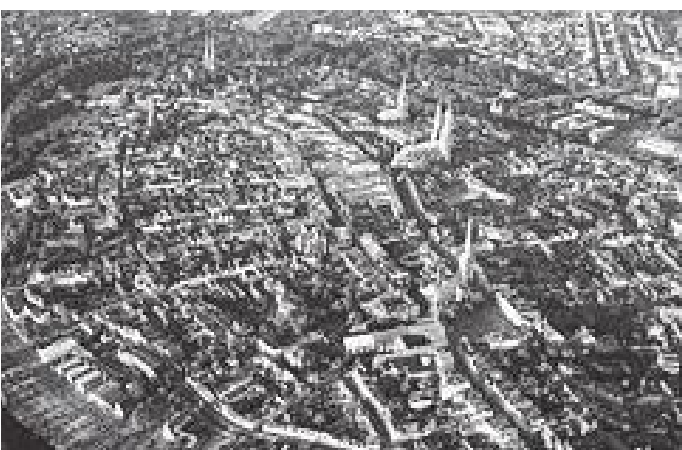
पूरे लुबेक सहर यस्तो देखिन्छ