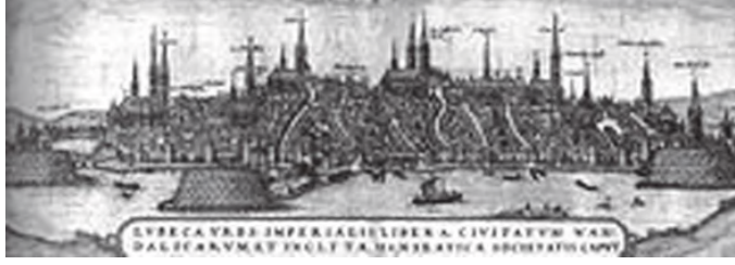
सोह्रौं शताब्दीमा लुबेक