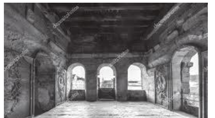
पोर्टा निग्राको छत