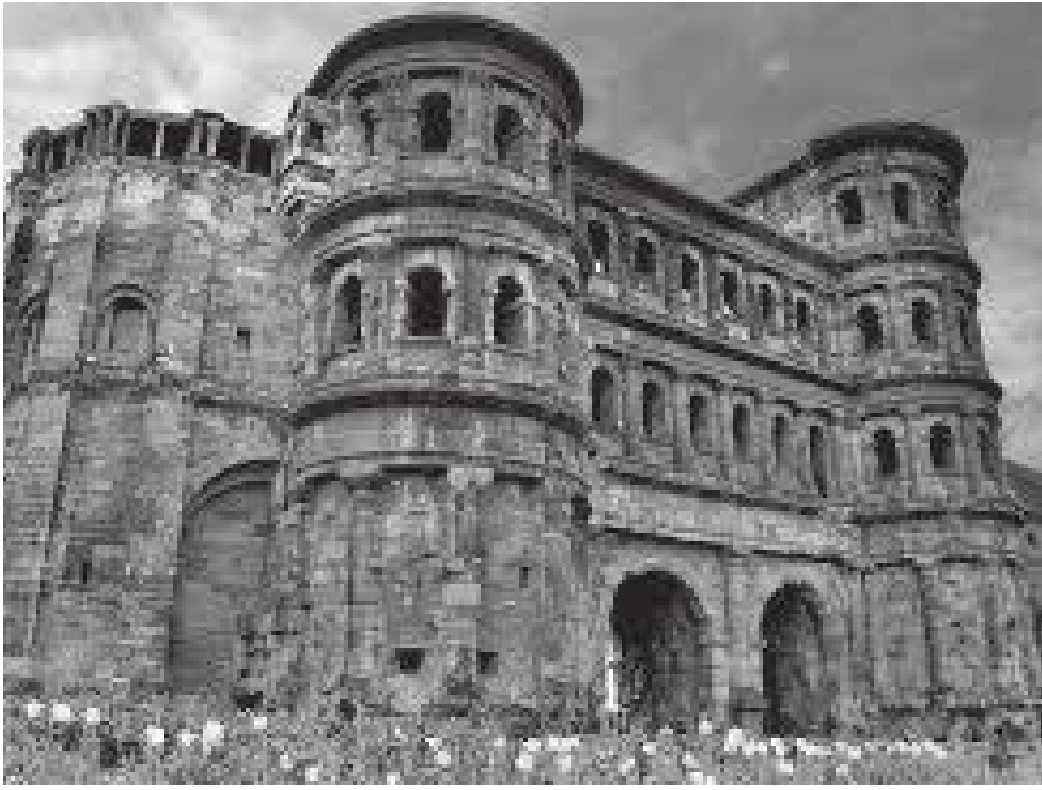
अगाडिबाट हेर्दा पोर्टा निग्रा यस्तो देखिन्छ