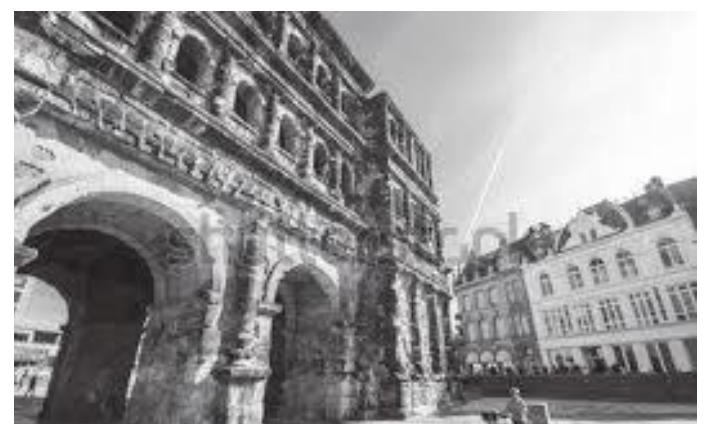
पोर्टा निग्राका दुई ढोकाहरू