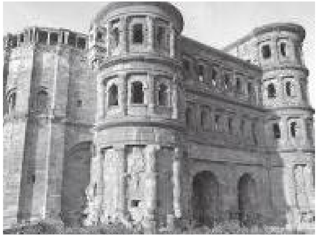
पोर्टा निग्राका दुई चारतले टावरहरू