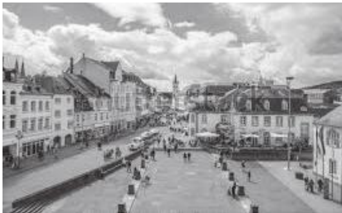
पोर्टा निग्राको छतबाट देखिने ट्रिअर सहर

पश्चिम टावरको एउटा भुज्याललाई भत्काई ढोका बनाई सर्वसाधारणलाई चर्चको प्रार्थना कक्षमा प्रवेश गर्न सहज बनाइएको रहेछ। सन १८०२ मा फ्रान्सका सम्राट नेपोलियनले यहाँबाट चर्चलाई हटाएको कारण पादरीहरूको वासस्थान (मोनास्टरी) यहाँबाट अन्यत्रै सारिएको रहेछ र पोर्टा निग्रालाई मध्यकालकै स्वरूपमा जिर्णोद्धार गरिएको रहेछ। जिर्णोद्धारपश्चात सम्राट नेपोलियन आफै यस द्वारको निरीक्षण गर्न सन १८०४ मा आएका