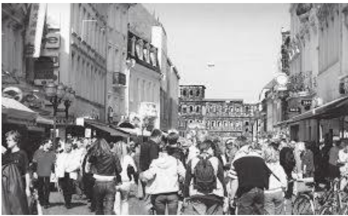
पोर्टा निग्रा अवलोकन गर्न आउने पर्यटकहरू