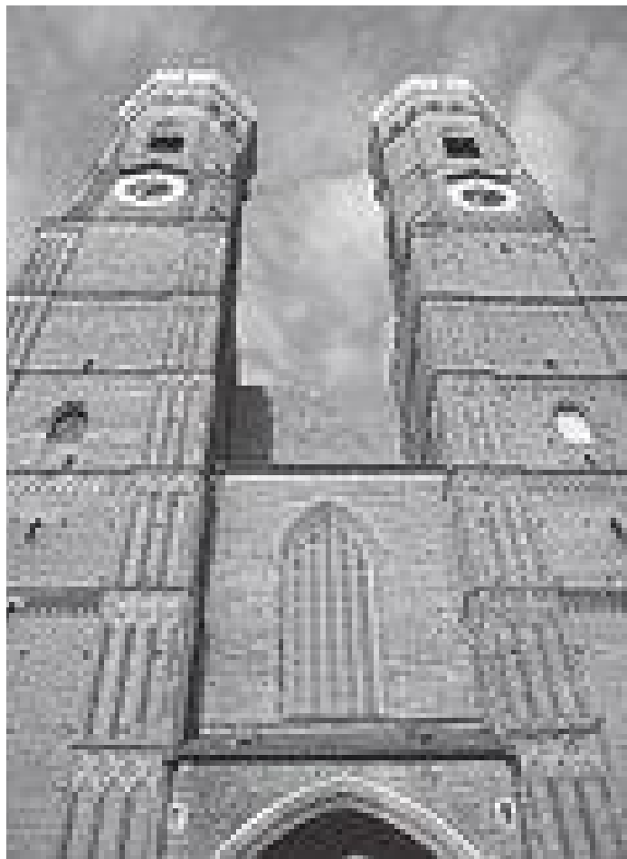
मेरियन डोमको टावरलाई मुनिबाट हेर्दा

पश्चिम बर्लिनको जर्मन भाषा सिक्ने काम सकेर प्रशासनिक विज्ञानको स्नातकोत्तर अध्ययन गर्नका लागि राइन नदीको किनारमा रहेको जर्मनीको पश्चिम दक्षिणतिर भ्रष्ट फ्रान्सको सीमा रहेको पुरानो सहर स्पायर आएको र विश्व सम्पदा सूचीमा रहेको त्यहाँको