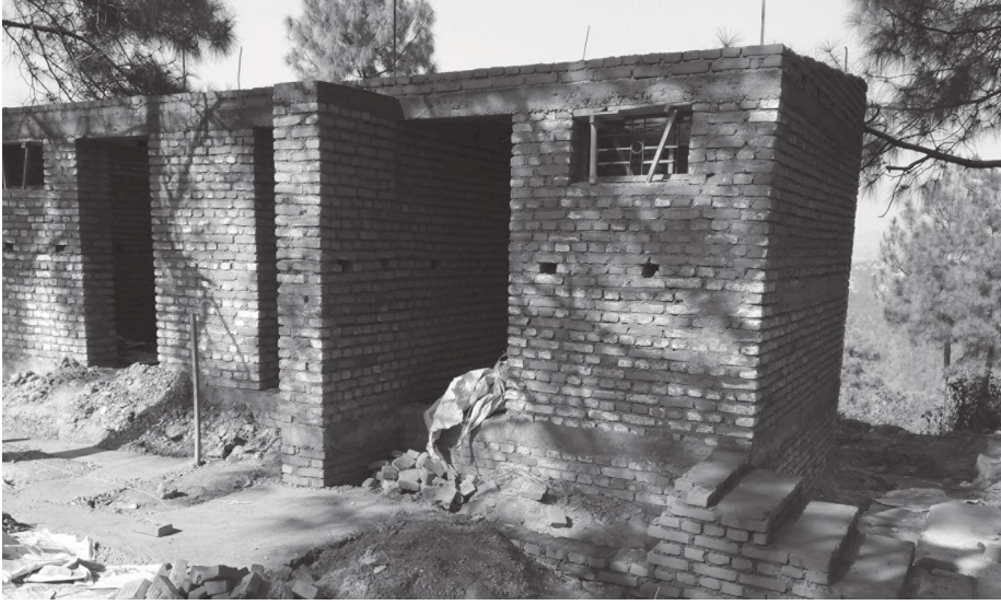
निर्माणधीन शौचालयको भवन