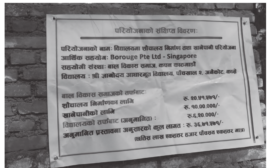
परियोजनाको बारेमा जानकारी राखिएको ब्यानर