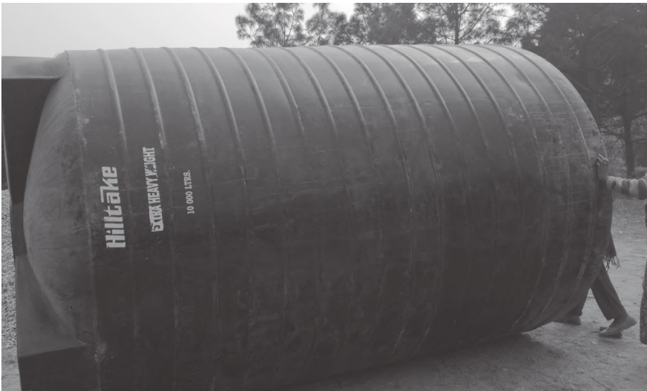
खानेपानीको लागि तयारी गरिएको १०,००० लिटरको ट्याँकी