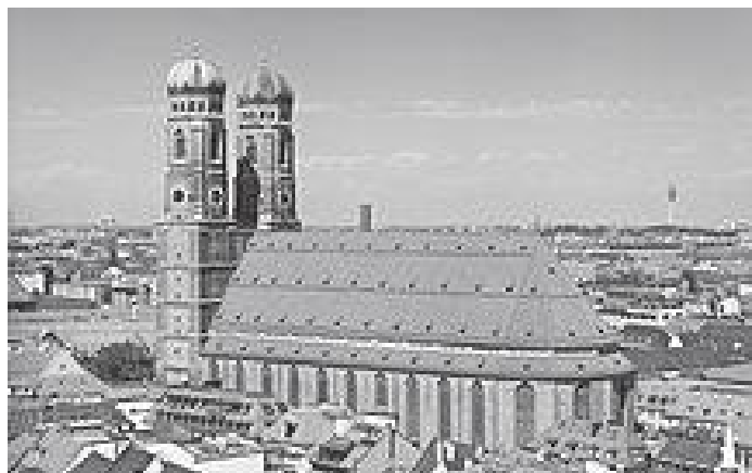
म्युनिक सहरको केन्द्रमा रहेको मेरियन डोम