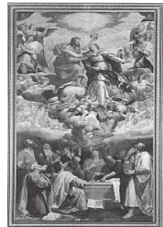
डोमभित्र रहेको विश्वविख्यात कलाकृति

पश्चिम बर्लिनको जर्मन भाषा सिक्ने काम सकेर प्रशासनिक विज्ञानको स्नातकोत्तर अध्ययन गर्नका लागि राइन नदीको किनारमा रहेको जर्मनीको पश्चिम दक्षिणतिर भ्रष्ट फ्रान्सको सीमा रहेको पुरानो सहर स्पायर आएको र विश्व सम्पदा सूचीमा रहेको त्यहाँको