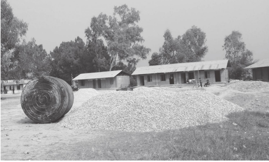
श्री ज्ञानोदय आधारभूत विद्यालयमा खानेपानी तथा शौचालय हुने स्थल