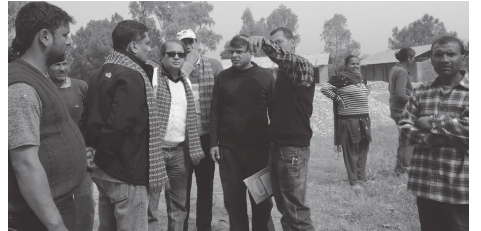
परियोजना स्थलको अवलोकन गर्दै Borouge टिम र बाल विकास समाजका प्रतिनिधीहरू

दार्ति सोसाइटी नेपाल नयाँ बानेश्वरमा इटालियन, अंग्रेजी र जर्मन भाषा सिक्की आत्मनिर्भर बनों । फोन : ९८५१०२३६००, ४४४९८९२