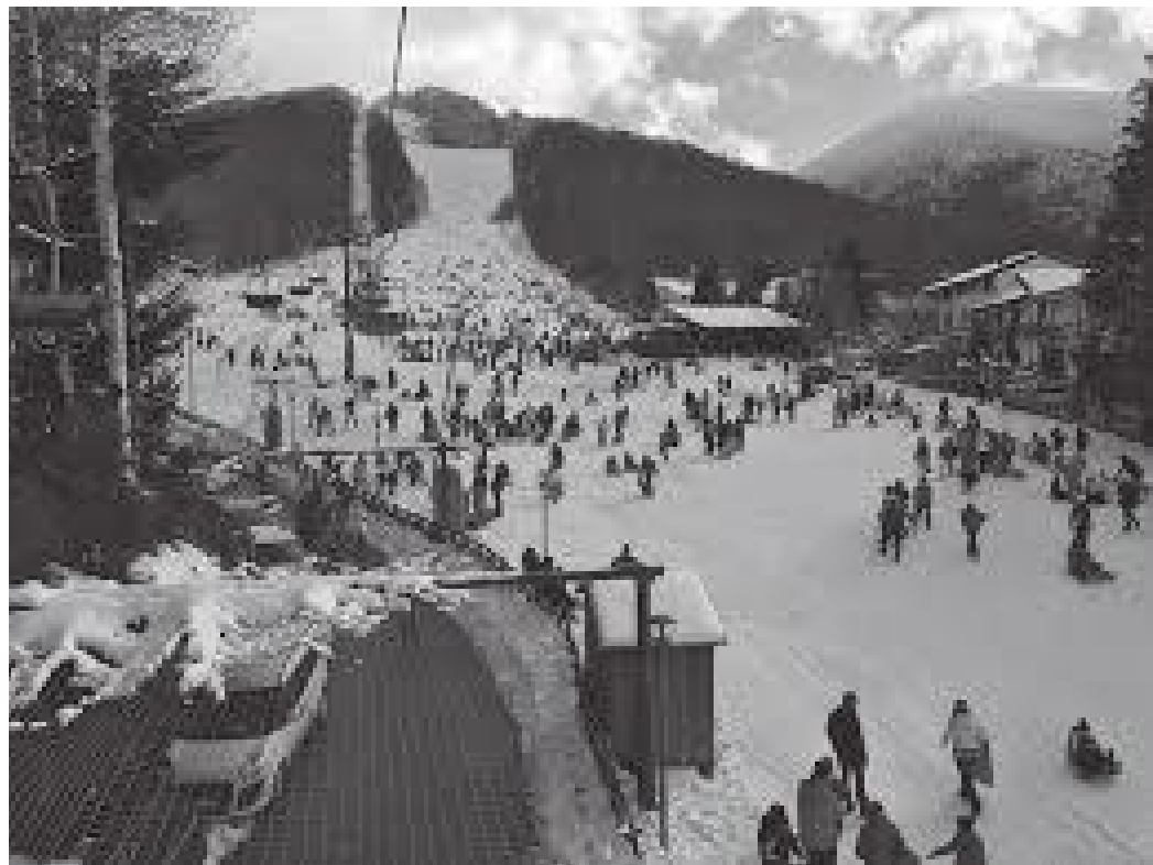
गाम्बारीमा पर्यटकहरू स्की गर्दै

डिसेम्बर १९९१ को पहिलो शनिबार पेन्ती दातिलो अवलोकन गरिसकेपछि हामी पुनः प्रशिक्षक प्रशिक्षणमै ब्यस्त भयौं । दोस्रो शनिबार कहाँ जान पाइने होला भन्ने कौतुहलता हामीमा हुनु स्वभाविकै थियो । नभन्दै विश्वविद्यालयले दोस्रो शनिबार त्यही कालाब्रिया क्षेत्रमा रहेको आस्प्रोमोन्ते राष्ट्रिय निकुञ्जभित्र रहेको गाम्बारी अवलोकन गराउन लैजाने समाचारले हामी निकै प्रफुल्ल थियौं र नभन्दै शनिबार बिहानै हामी गाम्बारीतर्फ लाग्यौं ।