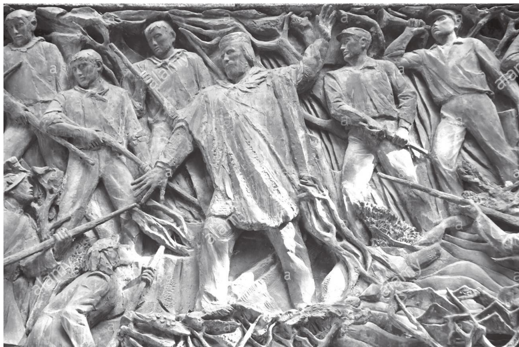
गाम्बारीमा रहेको इटालीको एकीकरण भल्काउने गैरिवाल्डीको मूर्ति