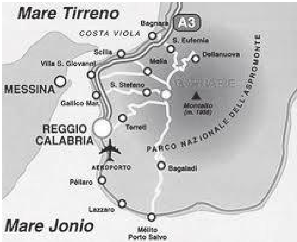
रेज्जो कालाब्रियामा गाम्बारीको अवस्थिति