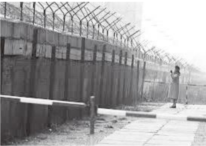
पर्खालको पूर्वी मोहोडा