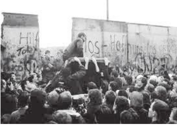
पर्खाल भत्काई दुवैतर्फका जर्मन नागरिकहरू एक भएको क्षण