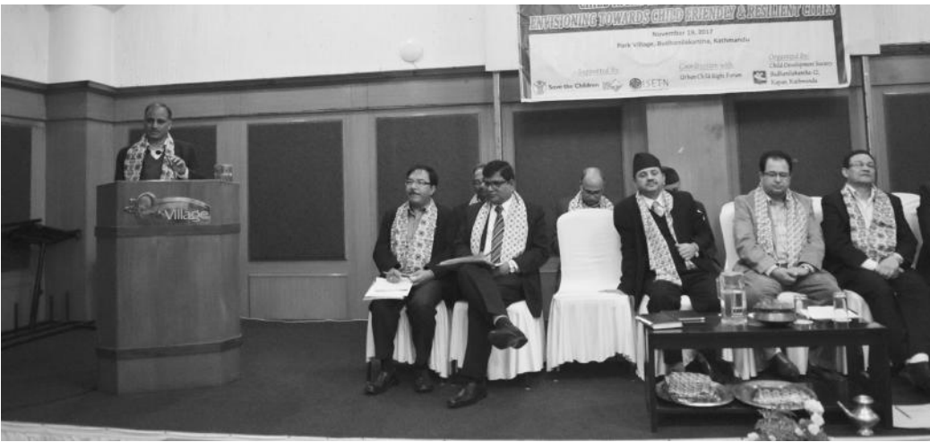
मन्त्र्य राख्दै केन्द्रीय बाल कल्याण समितिका कार्यकारी निर्देशक