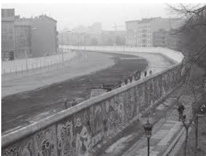
पेन्टिङ गरिएको पर्खालको पश्चिमी मोहोडा

सन् १९८५।८७ को इटलीको अध्ययन सकेर म १९८७ अक्टोबरमा नेपाल फर्किएँ। इटली पढ्न जानुअगाडि सन् १९८३ मा नै मैले जर्मनीमा प्रशासनिक विज्ञानमा स्नातकोत्तर अध्ययन गर्ने हेतुले छात्रवृत्तिका लागि आवेदन गरेको थिएँ। तर सन् १९८४।८६ को उक्त स्नातकोत्तर प्रोग्राम रद्द भएको लिखित सूचना आएको कारण म सन् १९८५ मा इटली पढ्न गएको थिएँ।