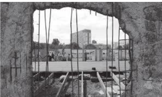
पर्खालको ठाउँ ठाउँमा जनताले यसरी प्वाल पारेका थिए