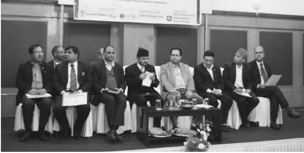
ड्यासमा आसिन अतिथि गणहरु