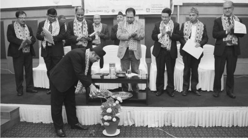
सम्मेलनको उद्घाटन गर्दै प्रधानमन्त्री कार्यालयका सचिव खगराज बराल