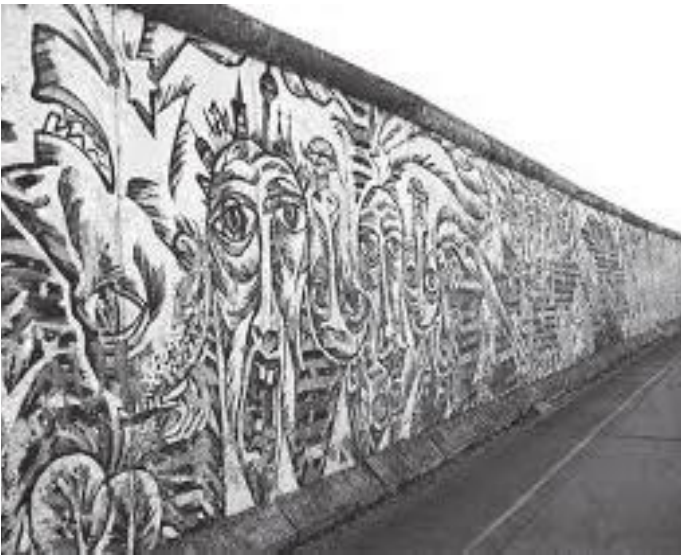
पर्खालको पश्चिम मोहोडामा जनस्तरमा गरिएको पेन्टिङहरू