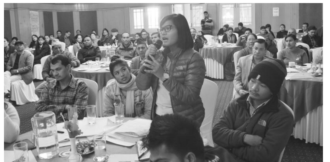
आफ्ना जिज्ञासा राख्दै बालकलव सञ्जालका प्रतिनिधि