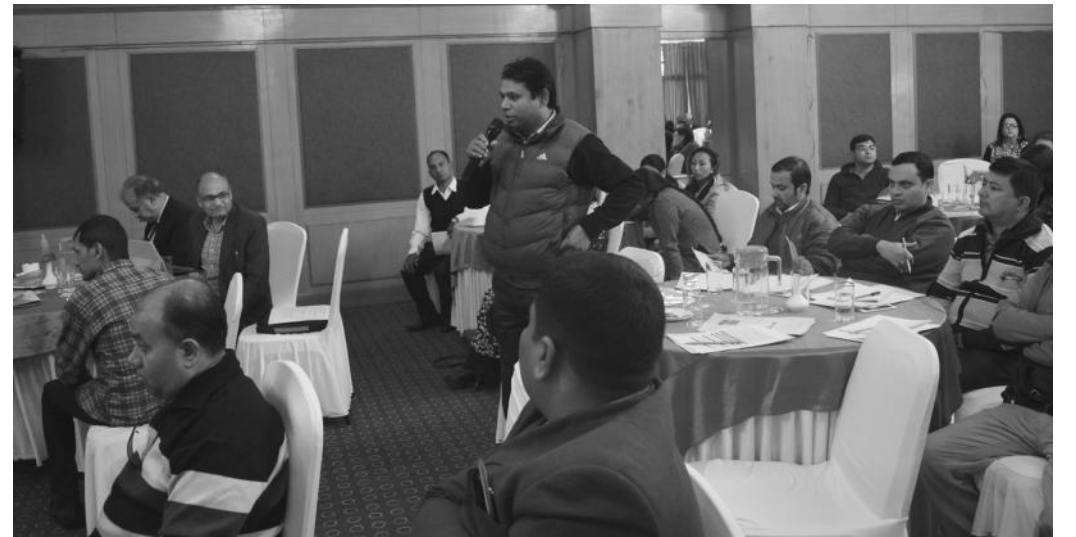
सम्मेलनमा जिज्ञासा राख्दै सहभागी