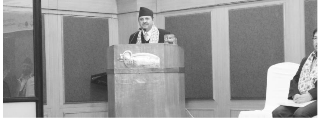
सम्मेलनमा मन्त्र्य राख्दै प्रमुख अतिथि