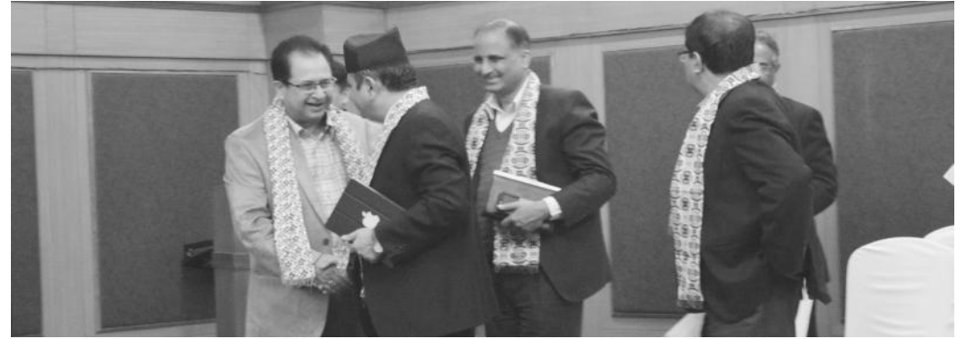
प्रमुख अतिथिलाई स्वागत गरिँदै