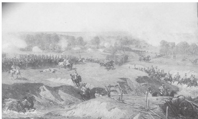
म्युजियमको भित्री भागको पेन्टिङ २