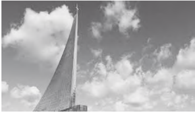
बादल छिचोल्दै कस्मोनट टावर