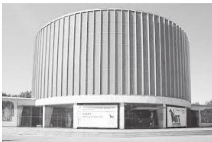
पानोरामा म्युजियमको अग्र भाग

मस्को पुगेको तेस्रो दिन हामीले मस्कोमा रहेको वोरोदिनो पानोरामा म्युजियम र कस्मोनट मेमोरियल म्युजियम अवलोकन गर्ने निर्णय गरी हामी त्यतातिर लाग्यौं । वोरोदिनो पानोरामा म्युजियम यो म्युजियम मस्कोमा रहेको दुई विश्वविख्यात युद्ध म्युजियममध्येको एक रहेछ । सन् १८१२ मा रसिया र फ्रान्सबीच भएको युद्धलाई पेन्टिङमा उतारी यस म्युजियममा सजाइएको छ । मस्को पुग्ने हरेक स्वदेशी विदेशीले यस म्युजियम हेर्ने अवसर गुमाउँदा रहेनछन् । वोरोदिनोमा भएको यस युद्धमा रूसी सेनाको नेतृत्व मार्शल मिखाइल कुतुचोभ र फ्रेंच सैनिकको नेतृत्व नेपोलियनले आफैले गरेका रहेछन् ।