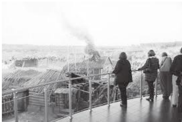
पानोरामा अवलोकन गर्दै पर्यटकहरू