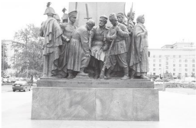
बोरोडिनो पानोरामा म्युजियममा रहेको योद्धाहरूको स्मारक