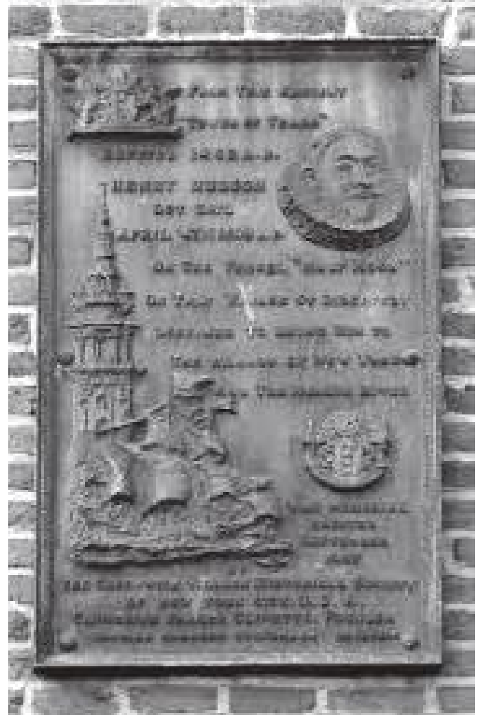
उड्पिड टावरमा रहेको रुन्चे महिलाको सम्झनामा राखिएको कलात्मक शिलापत्र