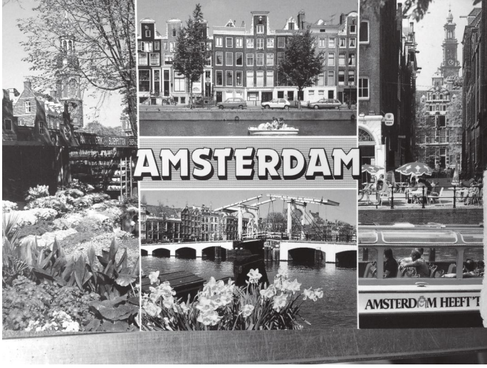
आम्सटरडमको पुरानो शहरमा त्यसबेला किनेको पोस्ट कार्ड