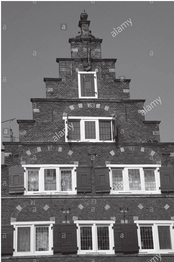
खुडकिला जस्तो देखिने यस्ता घरहरू फोरवुर्गवालको आकर्षण रहेछन्