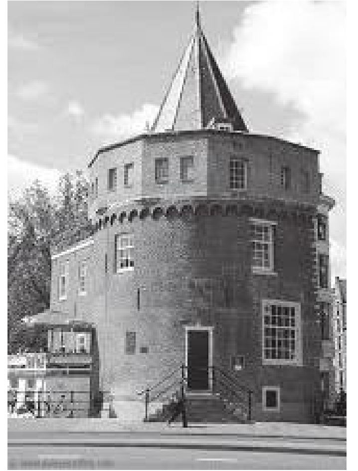
साइअरस्टोरेन अगाडिबाट यस्तो देखिन्छ