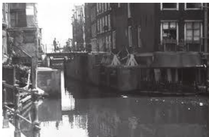
नहर बन्द गर्ने चालु अवस्था रहेको पुरानो ताल्वा