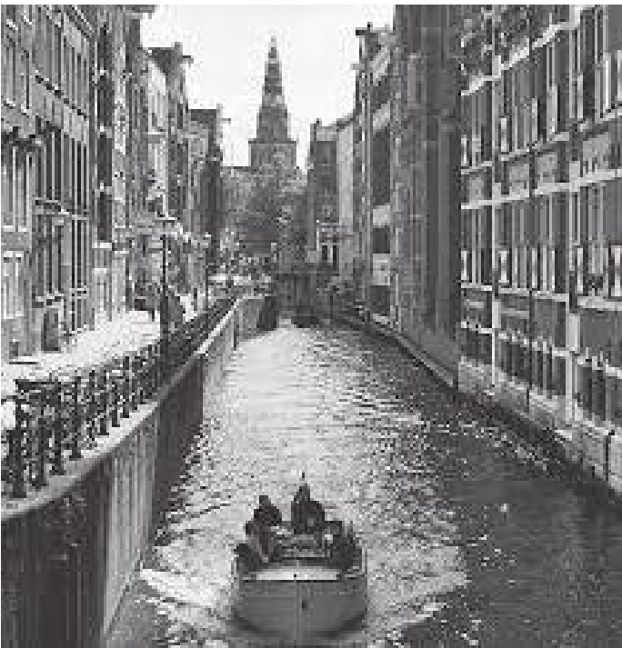
दुबैतर्फ पुरानो भवन र बीचमा नहर भएको आउडेजिड्स कोल्क