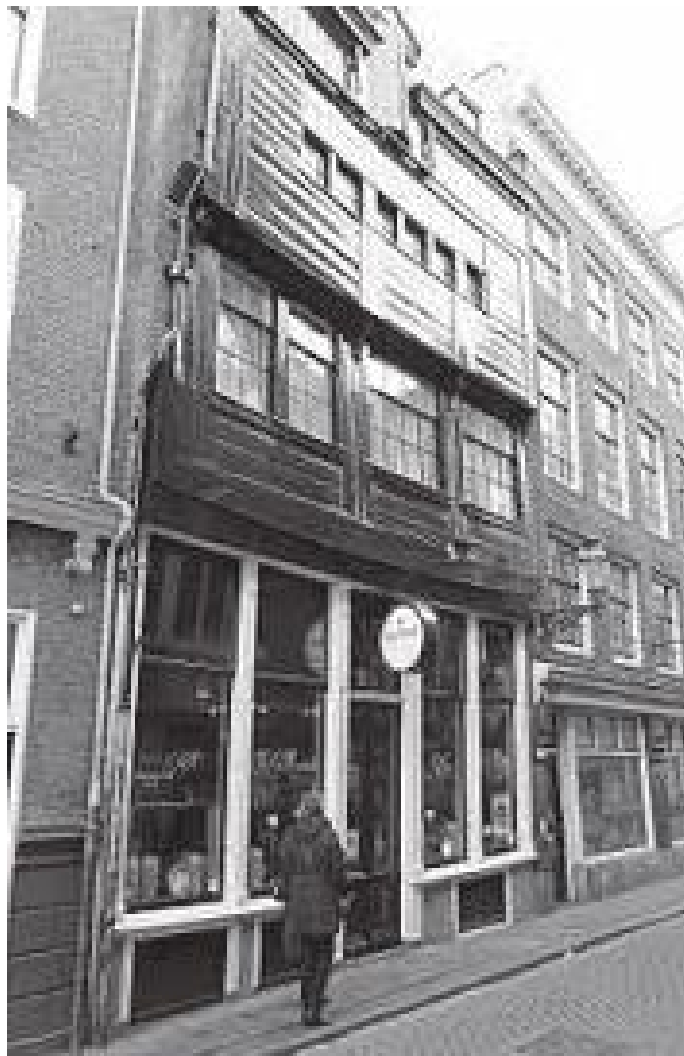
काठले बनेको मध्यकालीन हाउटेन हुइस