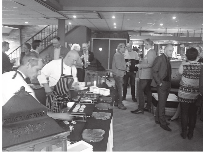
चालु अवस्थामा रहेको अंगुरको रक्सीको मध्यकालीन गोदाम