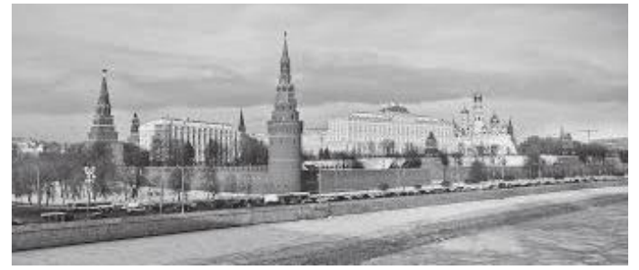
टावरसहित क्रेमलिनको पर्खाल