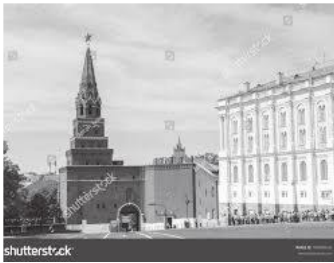
क्रेमलिनमा रहेको बोरोभिट्स्काया टावर