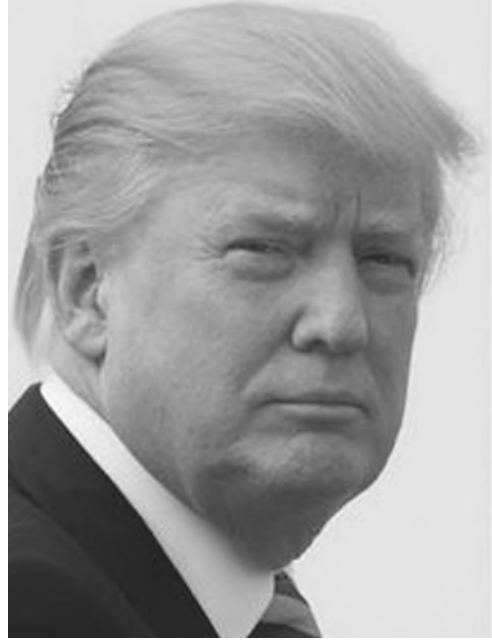
अधिकारीलाई ११ महिना लागेको बताइएको छ।

सुरक्षा रणनीतिमा ट्रम्पले मेक्सिकोसँगको सीमामा पर्खाल लगाउने उनको चुनावी वाचाको खाका पनि प्रस्तुत गरेका छन्। चारवटा सिद्धान्त समावेश गरिएको सुरक्षा रणनीतिको