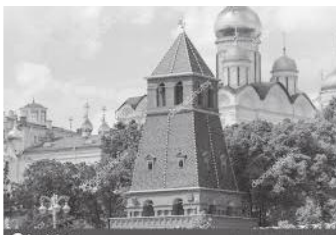
क्रेमलिनमा रहेको टायनिट्स्काया टावर