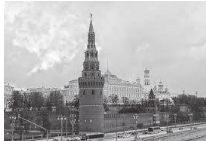
क्रेमलिनमा रहेको भोडोभ्जभोडनाया टावर