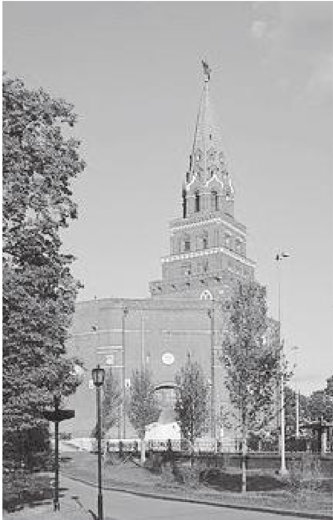
क्रेमलिनको कोटाफिया टावर