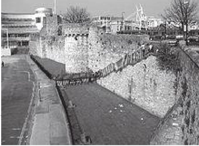
टुडोर हाउसको पर्खाल

१६औं शताब्दिमा यो घर कपडा उत्पादक तथा कपडा रंगाउने व्यवसायीहरूले प्रयोग गरेका रहेछन् । त्यसपछि पानीजहाज चलाउनेहरूले पनि यो घर प्रयोग गरेका रहेछन् भन्ने कुरा घरको भित्तामा गरिएको पानी