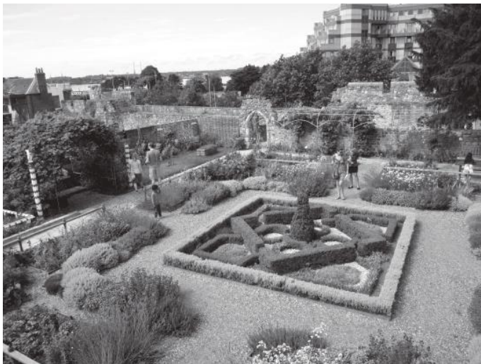
टुडोर हाउसको बगैँचा

स्यालिसवरीको क्याथेड्रल अवलोकन गरेपछि हामी साउदाम्पटन तर्फ लाग्यौं । त्यहा पुगेपछि हामीलाई थाहा लाग्यो की त्यहा अवलोकन गर्न लायकम विश्व प्रसिद्ध टुडोर हाउस र बगैँचा रहेछ भन्ने कुरा । साउदाम्पटनको गाडी पार्किंगमा आफ्नो गाडी थन्काई हामी लग्यो टुडोर हाउस तर्फ ।