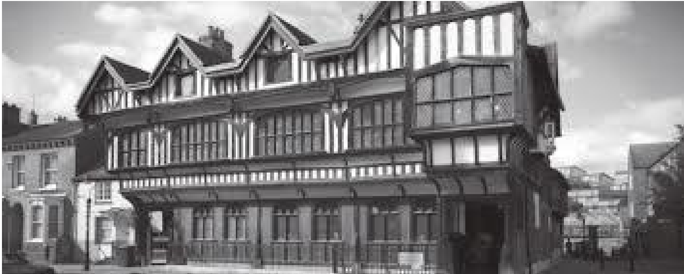
अगाडिबाट हेर्दा टुडोर हाउस यस्तो देखिन्छ