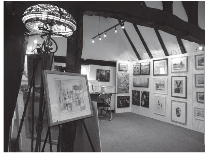
टुडोर हाउसको ग्यालरी

रहेछन् र त्यही बेला उनले ओक वृक्षको काठले बनेको अगाडिका मोहोडाका भित्तासँग रहेको ठाडो दलिनलाई रंगरोगन पनि गरेका रहेछन् । पछि १९औं शताब्दिमा गएर विभिन्न व्यवसायीहरूले यस घरलाई लिजमा (द्विर्घकालीन भाडा) लिई यहाँभित्र कपडा रंगाउने, पुस्तकहरू बाइण्ड गर्ने कार्य गर्दा रहेछन् । स्थिति विग्रँदै जाँदा १९औं शताब्दिको अन्तमा