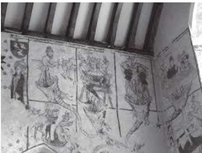
हाउसको भित्तामा गरिएका बहुमूल्य प्रिन्टिङहरू