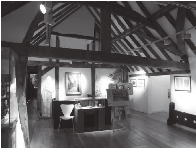
टुडोर हाउसको भित्री भाग