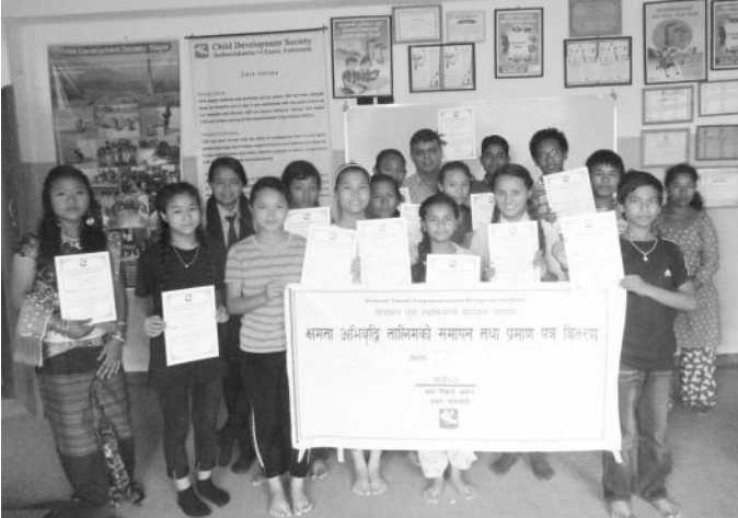
सामुहिक तस्वीरमा बालबालिकाहरू