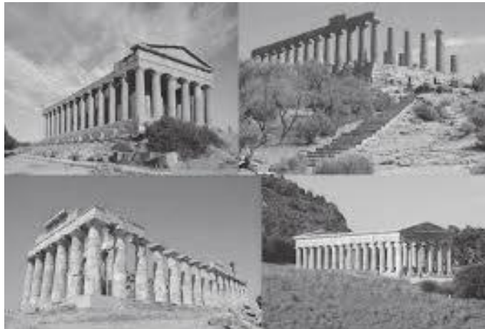
चारैतिरबाट जुनोको मन्दिर यस्तो देखिन्छ