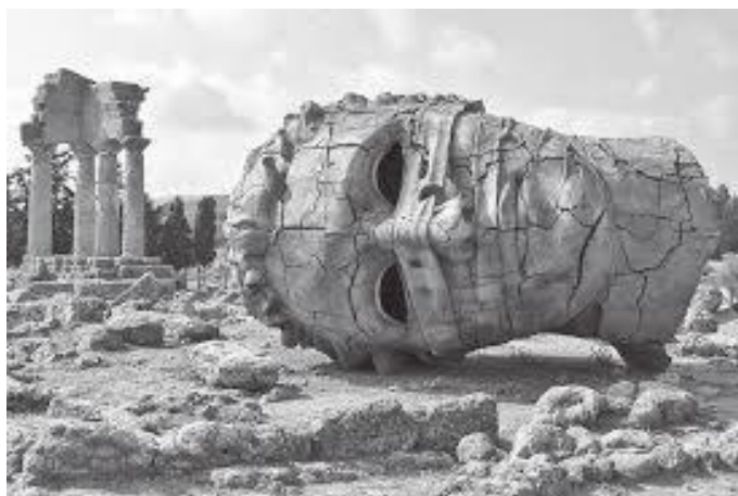
जुनोको मन्दिरछेउ लडिरहेको विशाल मूर्तिको टाउको