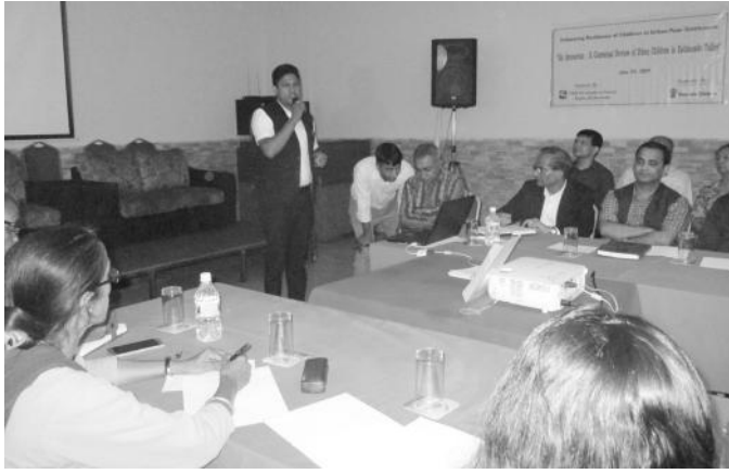
कार्यक्रममा बोल्दै जिल्ला समन्वय समिति काठमाडौंका वरिष्ठ सामाजिक विकास अधिकृत