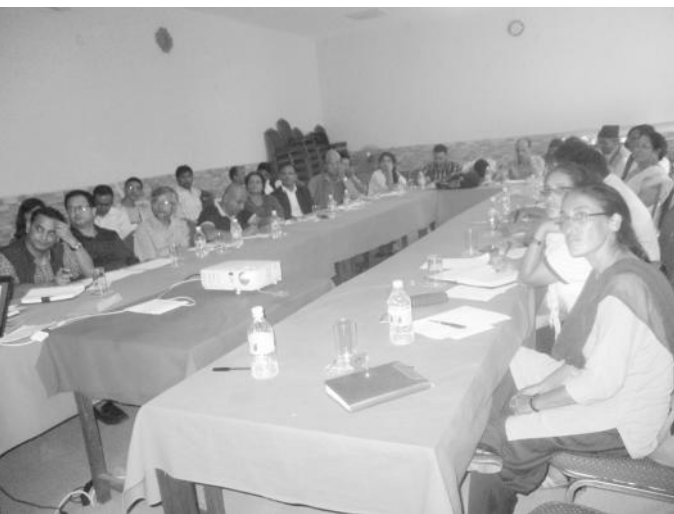
अन्तरक्रिया कार्यक्रमका सहभागीहरू