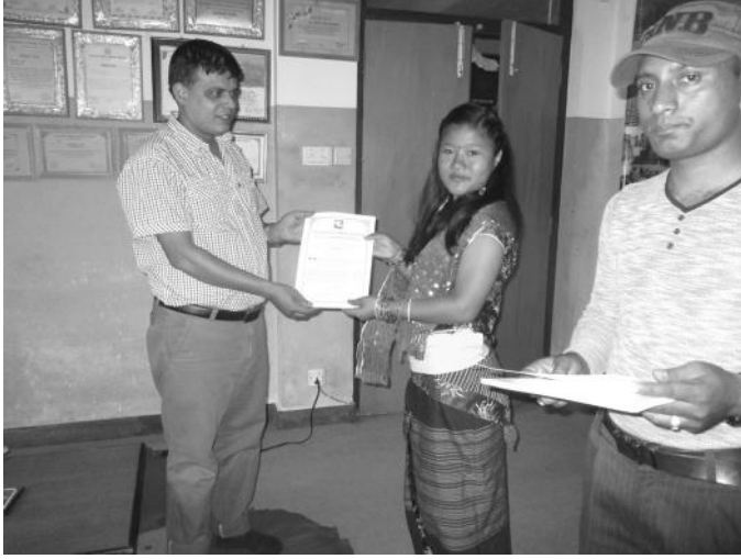
प्रमाणपत्र वितरण गर्दै वरिष्ठ प्रशासन तथा वित्तीय व्यवस्थापक