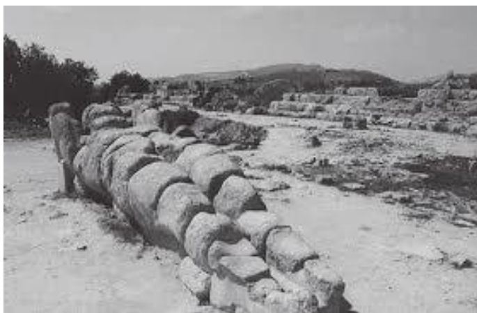
जुनोको मन्दिरछेउ लडिरहेको विशाल मूर्ति