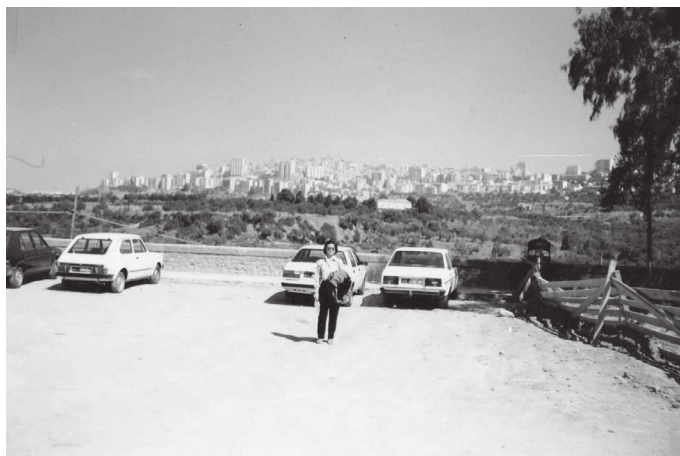
जुनोको मन्दिरबाट देखिने आग्रिजेन्तो सहर