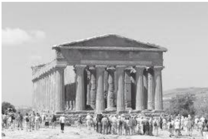
वैनिक हजारौं पर्यटक जुनोको मन्दिर पुग्छन्