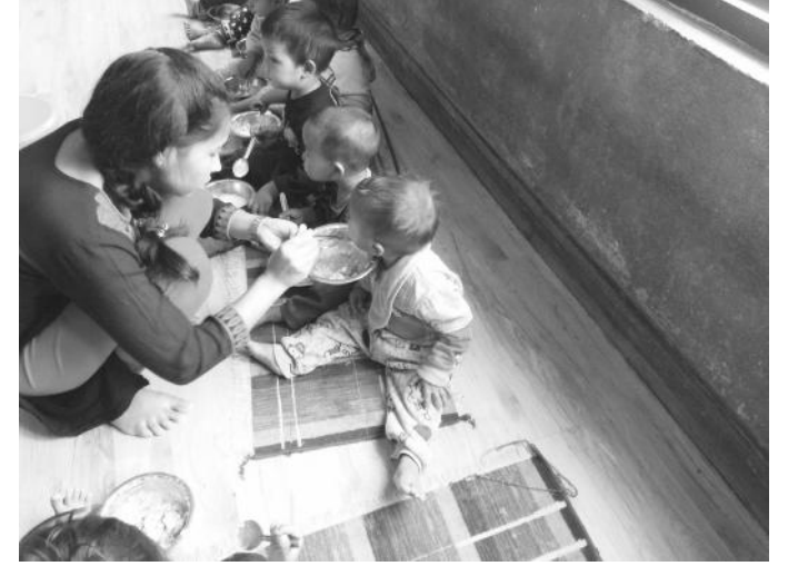
बालबालिकालाई खाजा खुवाउँदै संस्थाका सहजकर्ता