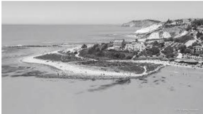
भूमध्यसागरको तटमा रहेको आग्रिजेन्तो सहर