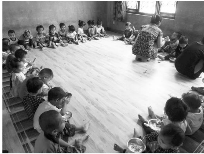
२ खाजा खाँदै केन्द्रका बालबालिकाहरू