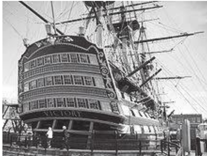
जहाजको अगाडिको मोहोडा यस्तो रहेछ