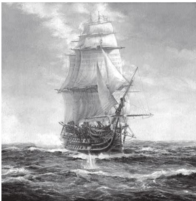
समुद्रको बीचमा HMS भिक्ट्री जहाज

यो मध्यकालिन युद्धपोत जहाजको डिजाइन सर थोमस स्लेडले गरेका रहेछन् जो त्यतिखेर बेलायती जलसेनाका सर्भेयर रहेछन्। यो जहाज बनाउनका लागि त्यही बेलामा नै ६३ हजार १७६ बेलायती पाउण्ड खर्च भएको रहेछ र