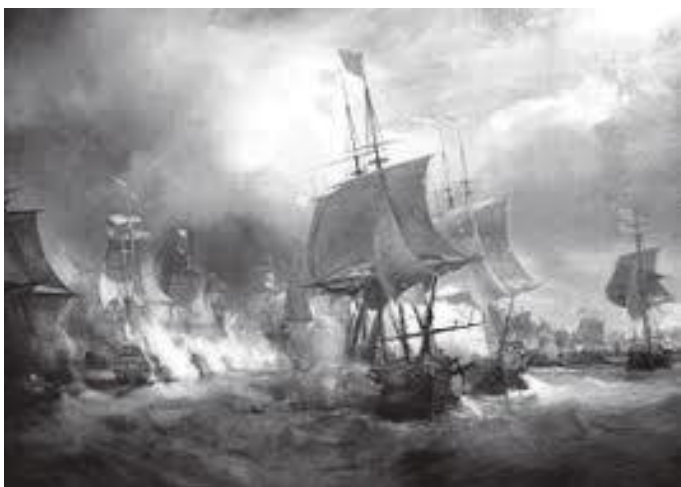
उसान्तको पहिलो युद्धमा यो जहाजको प्रयोग यसरी भएको रहेछ

टुडोर हाउस र बंगैचा हेरी सकेपछि हामी पुनः डोभर फर्कने क्रममा HMS भिक्ट्री जहाज अवलोकन गर्न बेलायतको एटलान्टिक महासागरको पोर्टस्माउथको पश्चिम तटमा पुग्यौं। १०४ वटा तोप आकारको बन्दुक जडित काठैकाठले बनेको यो जहाज बनाउने आज्ञा सन् १७५८ बेलायती प्रधानमन्त्री पिट द एल्डरले दिएका रहेछन्।