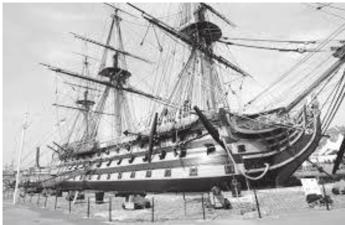
सिंगो जहाज यस्तो देखिँदो रहेछ

त्यसलाई अहिलेको मूल्यमा भन्ने हो भने ८० लाख पाउण्ड हुँदोरहेछ। बेलायतले लडेको क्युबेक, मिण्डेन, लागोस, क्युवेरोन खाडी आदिको सात वर्षे युद्धमा आश्चर्यजनक जीत हात पारेको कारण यस जहाजको नामनै HMS भिक्ट्री जहाज राखिएको रहेछ। त्यसपछि यस्को राम्रो मर्मत संभार गरी सन् १८०५ मा भएको ट्राफल्गरको युद्धमा सेनापती लर्ड नेल्सनको नेतृत्वमा प्रयोगमा आएको रहेछ।