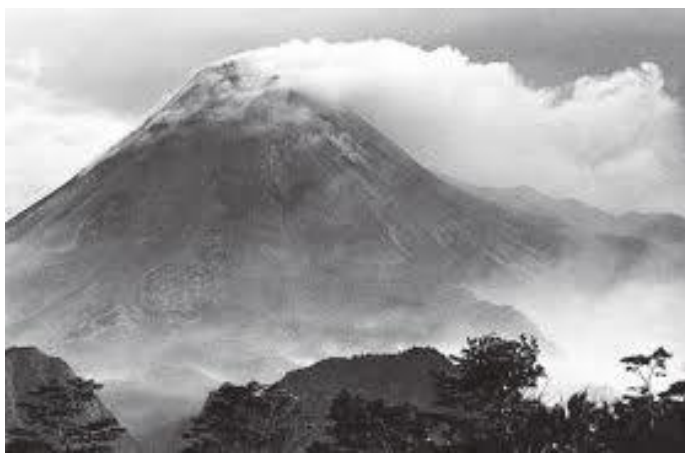
ज्वालामुखी पड्केको अवस्था