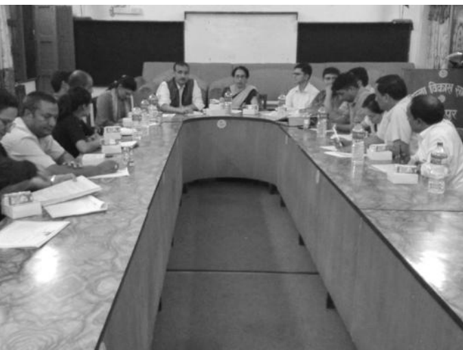
जिल्ला परियोजना सल्लाहकार समितिको बैठकका सहभागी