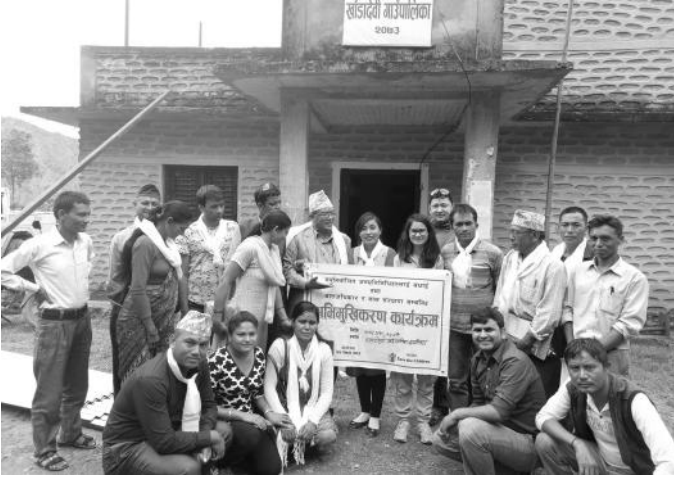
बाल अधिकार, बाल संरक्षणसम्बन्धी अभिमुखिकरण कार्यक्रमका फलकहरु