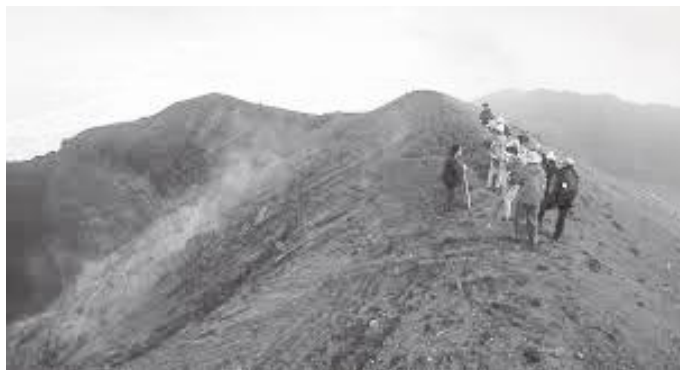
यसरी पुग्छन् एट्नाको टुप्पामा पर्यटकहरू