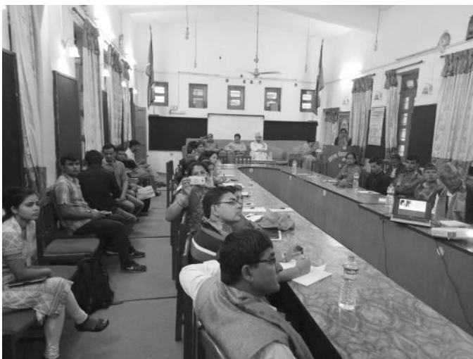
जनप्रतिनिधिहरुको लागि बाल अधिकार र संरक्षण सम्बन्धी कार्यक्रमका फलकहरु