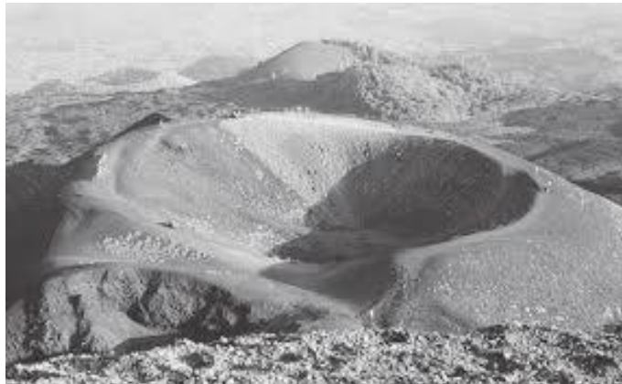
टुप्पाबाट तल हेर्दा ज्वालामुखीको मुख यस्तो देखिन्छ