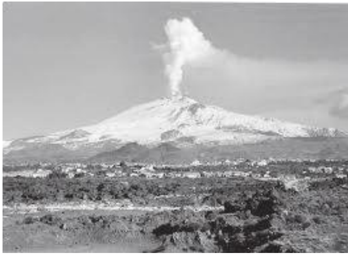
हिमपात भएको बेलाको एट्ना