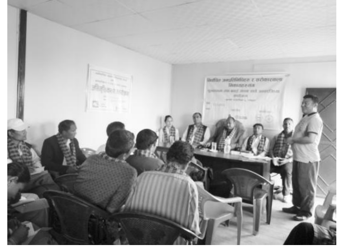
बाल अधिकार, बाल संरक्षणसम्बन्धी अभिमुखिकरण कार्यक्रमका फलकहरु